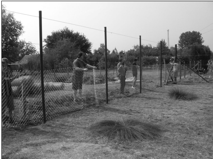
Munka közben a segítők

Az általános iskola sportpályája körüli drótháló az idők folyamán elhasználódott, megrongálódott és veszélyessé vált. Iskolai, önkormányzati és szülői összefogás segítségével a régi hálót leszedték és újat helyeztek fel a helyére. Mielőtt ehhez hozzáfogtak volna, alapos takarításra is szükség volt, hiszen belenőtt tujákat, fákat, gyomokat kellett eltávolítani, hogy egyáltalán a hálóhoz hozzáférhessenek.