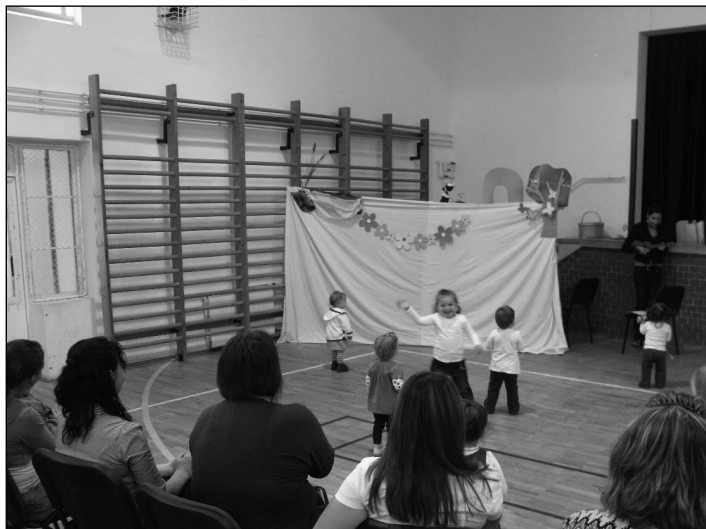
A bábelőadást nagyon élvezték a gyerekek

hígabb, zsírban szegényebb, míg később zsírdús, energiában gazdagabb tejet szopik a baba. További előnyei még: mindig kéznél van, megfelelő a hőmérséklete, nem kerül pénzbe.