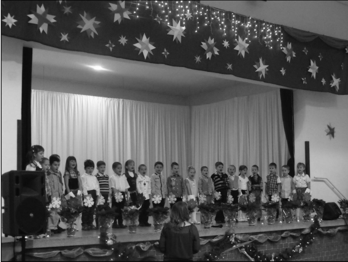
A nagycsoportos óvodások

téli dalokat és verseket hallhatott a közönség.