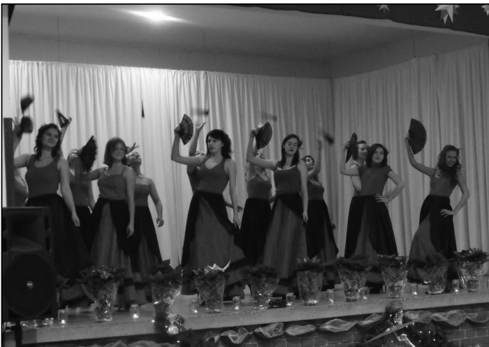
A mazsorettes lányok

A mikulás báli forgatagot a 8. osztályosok nyitó tánca kezdte. A mulatozás közben megérkezett a Télapó, akinek segítségével nagyon sok értékes tombolatárgyat sorsoltak ki, ezután pedig hajnalig tartott a mulatozás.