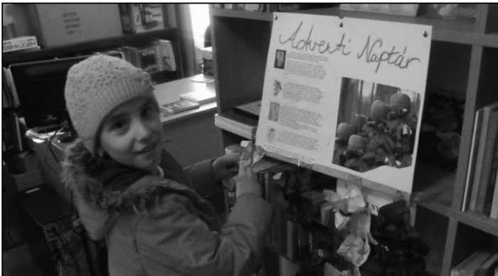
Az első mosolygós kisgyermek

Közeleg a karácsony, amit nemcsak a zord idő vagy a múlt napok jeleznek, hanem egy nagyon régi, ámde annál is inkább szép szokás, az adventi várakozás is erősít. A mi kis könyvtárunkban is jelét adtuk ennek a várakozásnak, és elkészült egy adventi naptár, melynek segítségével a fiatalság nyomon tudja követni, mennyi napot kell még aludniuk a várva - várt szentestéig. Így minden egyes nap, mosolyt csalunk egy gyermek arcára, mikor kibonthatja az aznapi kis meglepetést, amit a naptár tartalma rejt. A várakozás bennünk felnőttekben is lezajlik, jusson eszünkbe azonban az, hogy milyen szép gesztus is, mikor egy másik embertársunkat megajándékozunk.