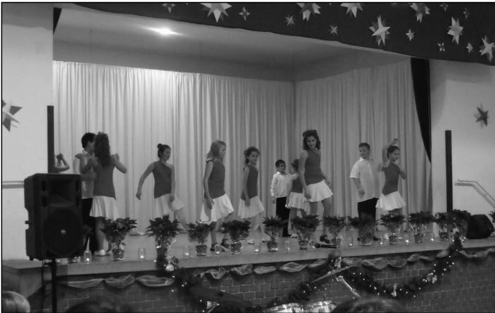
A negyedik osztályos táncosok