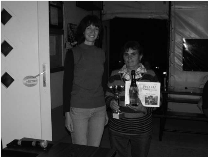
Győztes a zsűri elnökével