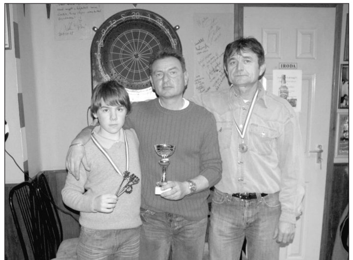
A képen az első három helyezett látható

Gól Söröző kupa darts verseny 2010. 03. 14.-én került