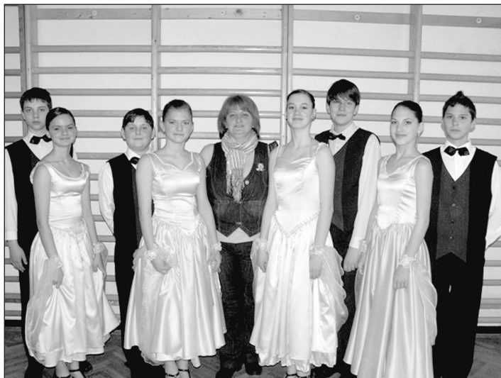
A táncosok felkészítő tanárukkal