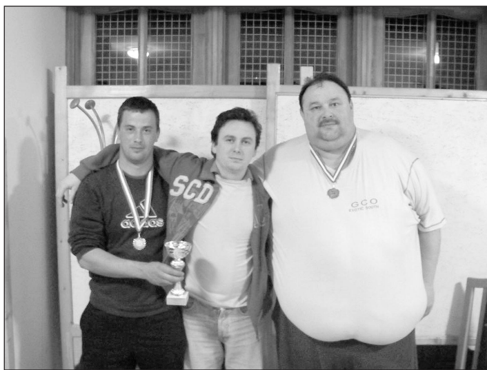
A képen az első három helyezett látható