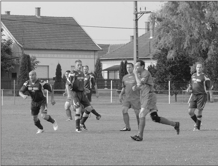
Küzdelem az első bajnokin

Fiataljaink fejlődése érdekében, visszatértünk a Csongrád Megyei Labdarúgó III. osztályú bajnokságba, ahol Csongrád II. csapatával egy jó mérkőzésen 2:0 vezetésről kaptunk ki 3:2-re köszönhetően az ellenfél nagyobb rutinjának, tapasztalatának.