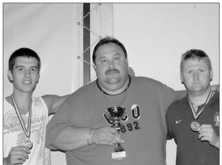
Az első három helyezett

2010. szeptember 3-án tartottuk soron következő póker versenyünket, ahol az alábbi eredmények születtek: