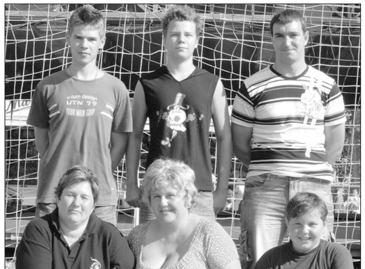
11-es rúgóverseny helyezettjei