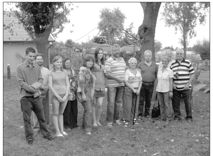
A kurzus résztvevői, a szervezők és segítők