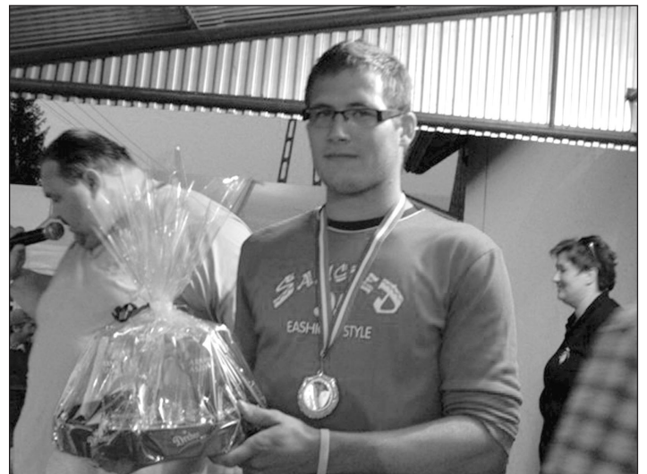
A sörívő verseny II. helyezettje

21 órától DJ Roberto gondoskodott a jó hangulatról Retro discojával, amit két program beiktatásával próbáltunk színesebbé tenni és a közönség ovációjából mérve jól sikerültek a betét programok. Először a Tűzfátyol hastáncsoport bemutatójára jött lázba a közönség, majd pihenés képen, hét sörívő mérte össze tudását gyorsasági sörívásban, ahol a következő eredmény született: