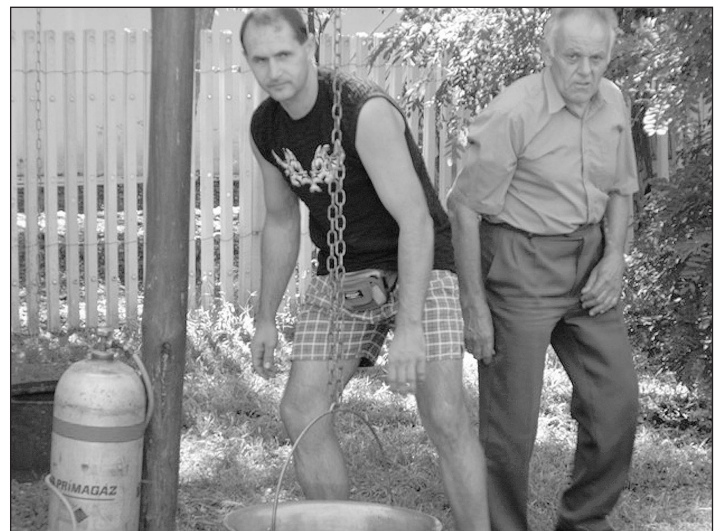
Készülődik az egyik győztes csapat

2010. augusztus 20-án birkapörkölt főzőversenyt rendeztünk a Gól Sörözőben. Jó hangulatban remek pörköltet rotyogtak