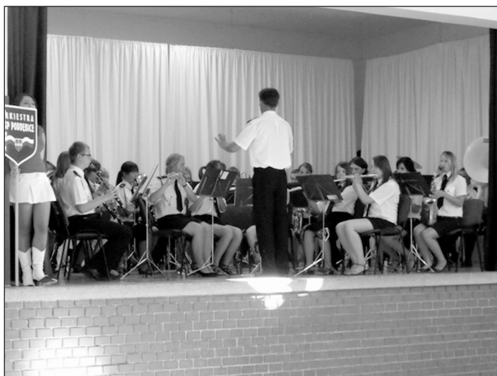
A Poddebicei Önkéntes Tűzoltózenekar