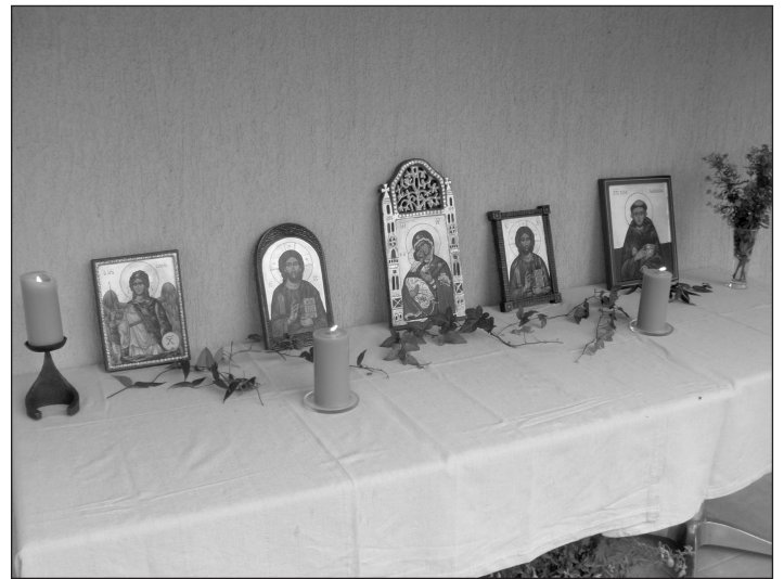
Az elkészült ikonok