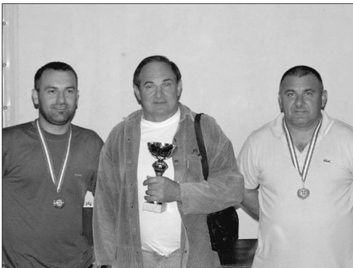
Az első három helyezett

2010. július 30-án 12. alkalommal rendeztük meg a