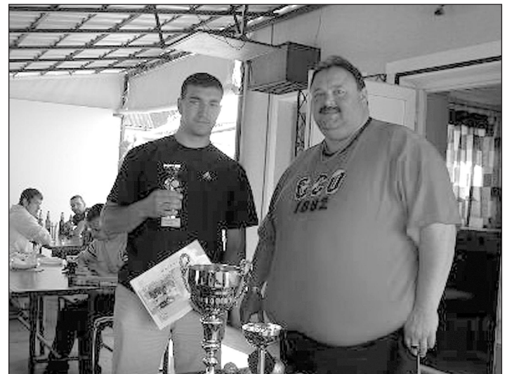
A III. helyezett csapat vezetője és a szervező a kupával