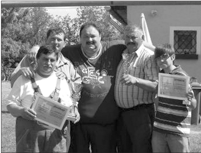
A főzőverseny helyezettjei a szervezővel

A következő főzőversenyünk 2009. július 18-án szombaton 9 órai kezdettel (kakaspörkölt főzőverseny) Várjuk a régi és az új szakácsokat a versenyre.