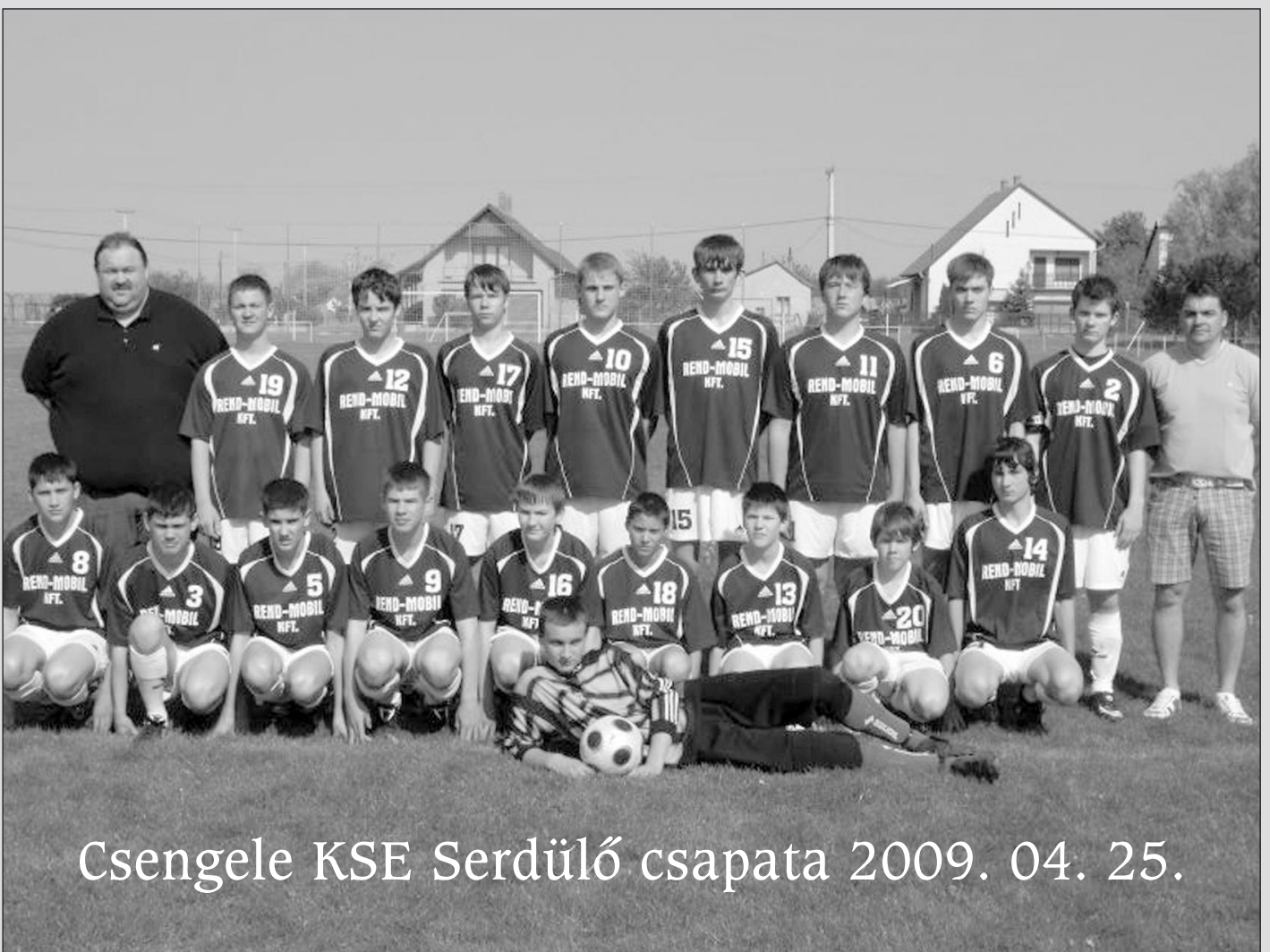
Csengele KSE Serdülő csapata 2009. 04. 25.