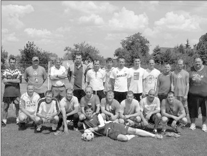
Az edzőképzés résztvevői a két PRO LICENCE-s előadóval