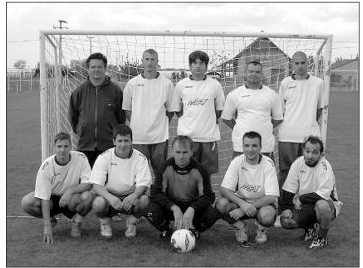
A győztes csapat