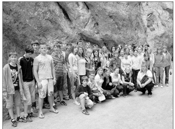
A kiránduló csapat