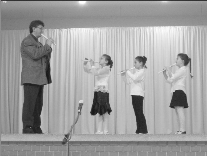
A legkisebb furulyások tanárukkal

Őket a Csengelei Népdalkör és Citerazenekar műsora követett, akik nagy izgalommal és szeretettel adták elő dalsokrukat. Néhányan a közönség soraiból csatlakoztak is hozzájuk.