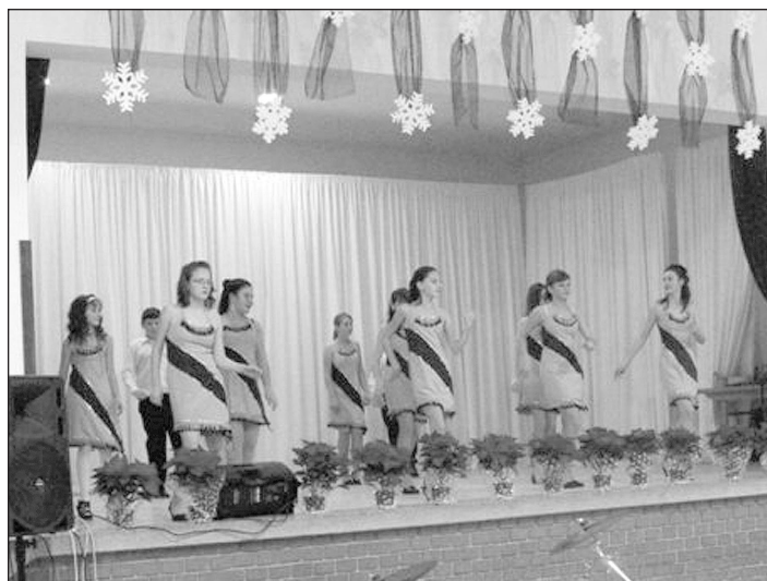
A 6. 7. osztályosok mambó közben