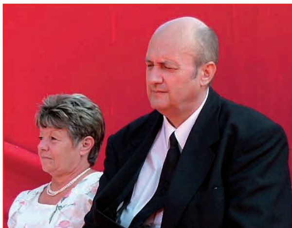
A dombrádi idei Szent István-nap két kitüntetettje