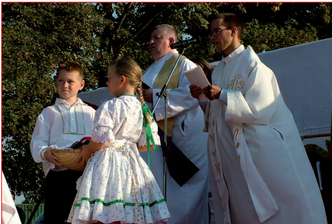
Augusztus 20-án a hagyományokhoz híven megszentelték az új kenyeret