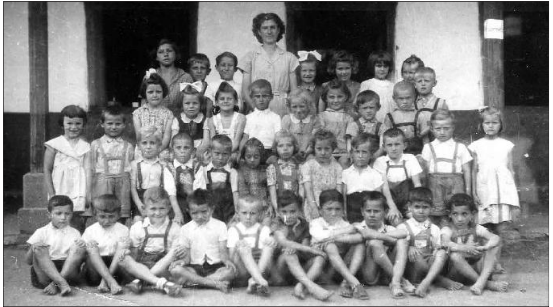
Osztálykép a tanítónővel 1956-ból

Az, hogy mennyire szerette a hivatását talán az a mondása bizonyítja a leg-