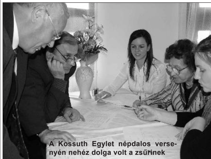
A Kossuth Egylet népdalos versenyén nehéz dolga volt a zsűrinek

KÖSZÖNET A Dombrád és Térsége Kossuth Egylet köszönetet mond mindazoknak, akik személyi jövedelemadójuk 1%-át az elmúlt évben az Egyletnek ajánlották fel. Az összeget az alapító okiratban meghatározott célokra, hagyományápolásra, -részt használták fel az Egylet. Köszönettel várjuk ez évben is felajánlásukat. Adószámunk: 18807589-1-15.