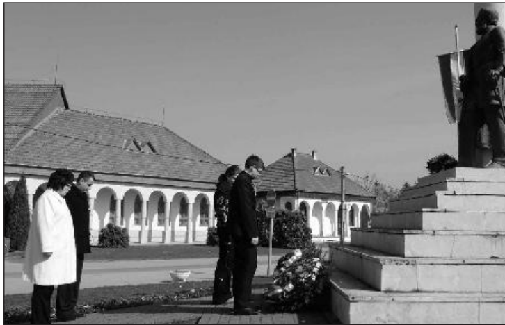
Koszorúzás március 15-én