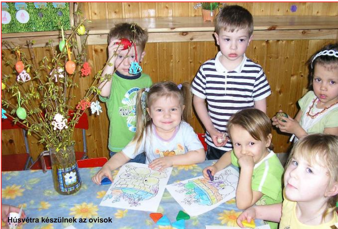
Húsvétra készülnek az ovisok