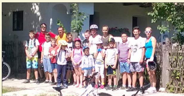
Kerékpáros túrázóink Zamárdiban a tájháznál