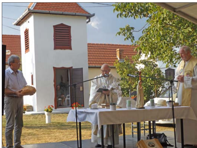
Augusztus 20-i ünnepi szentmise Kisgeresden