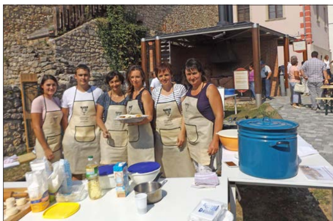
Pécsváradon a Határtalan Lakomán is készült Geresdlaki Gőzgombóc