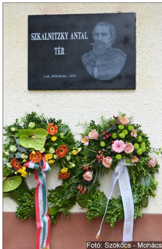
Fotó: Szököcs - Mohács