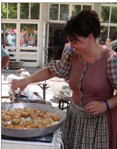
A Zebegényi Gőzgombóc Fesztiválon

- Rendezvényeinken is ti készítek a dekorációt. Már évek óta te készíted a Gőz-