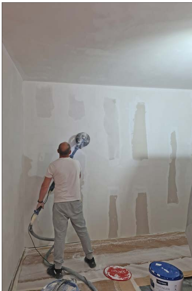
A könyvtár felújítása lassan a végéhez közeledik. Reményeink szerint nyáron már használhatjuk!