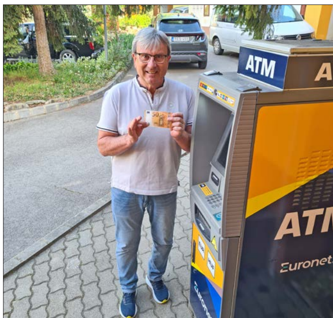
A gereszlaki önkormányzat saját erőből üzemelteti a bankfüggetlen bankautomatát, melyből eurót és forintot is lehet kivenni