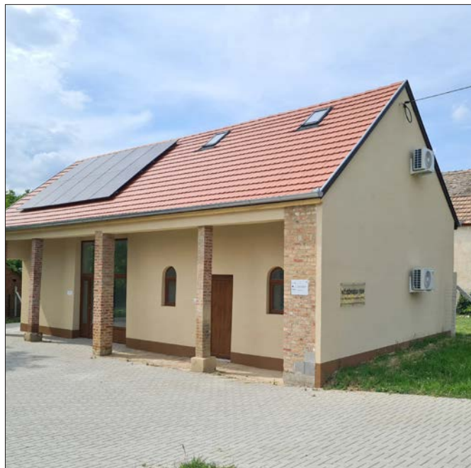
...és ilyen lett