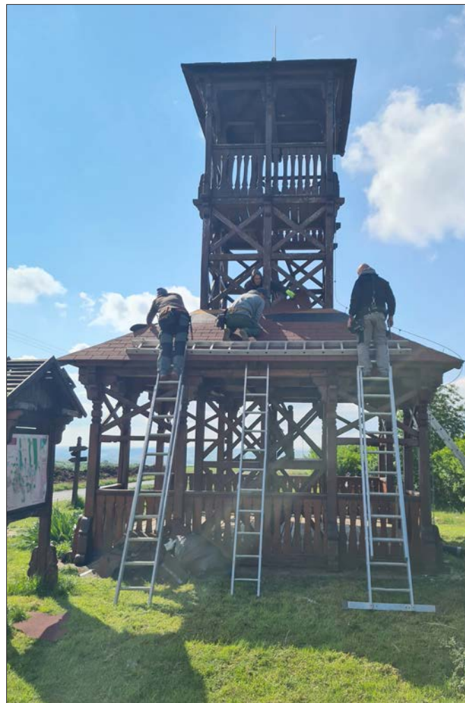
Felújítottuk a geresdlaki kilátó tetőszerkezetét