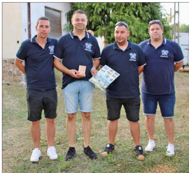
Szintén Gereszlakért-díjat vehetett át a Mecseknádasdi Önkéntes Kiemelten Közhasznú Tűzoltó Egyesület a finn kisfiú megtalálásáért

A megyeszékhelyen is hirdetik a plakátok a rendezvényünket. A Gereszlaki Gőzgombóc Fesztivál reklámfelülete Pécssett