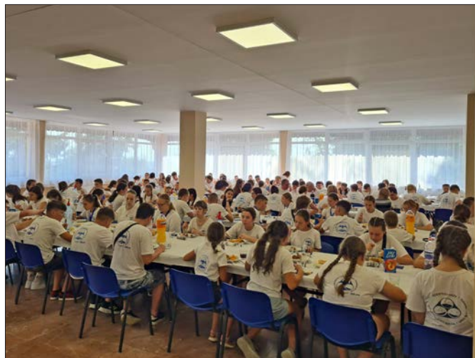
Ebédrel fogadtuk a 150 fős Szentegyházi Gyermekek Filharmóniát felújított éttermünkben