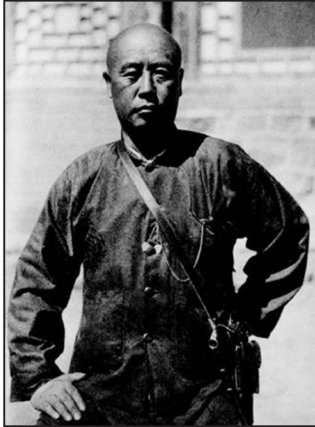
2. Csaojang. Tien Fongjü, az udvarias rendőrfőnök (Ligeti: 417.)

A sort egy főrendőr nyitotta meg. Katonásan üdvözölve jelentette, hogy a rendőrfőnök, Tien Fongjü megbízásából jelentkezik, és ha kívánom, mindennap két katonát küldenek Deva csenpó ajtaja elé – őrt állni, nehogy valami bajom essék. Bármennyire is elérzékenyültem ennyi figyelem és jóindulat láttára, velejében kétségbeesve tiltakoztam. Hogyne, még csak az hiányzik nekem, hogy semmirekellő kínai katonák ólálkodjanak körülöttem naphosszat, és sohase lehessen tőlük egy nyugodt percem se. Nem is beszélve a zsoldról, meg a menázsiról, melyről aztán nekem illenék gondoskodnom. Csak megvoltam jóval veszedelmesebb helyeken is anélkül, hogy kínai katona állt volna őrt az ajtóm előtt, majd megleszek itt is, ahol végeredményben egy nagy város szívében, s egy kolostor kellős közepén lakom. Tehát nagyudvariasan megköszöntem Tien Fongjü rendőrfőnök úr figyelmét, s azonnal elküldtem tiszteletem jeléül a névjegyem, meg – egy kis ajándékot.