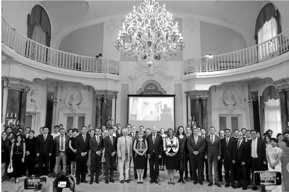
15 éves jubileumi gála az Aula Magnában 2022. június 21-én.

egyéni teljesítmény elismerésének örülhet. Létrehozta az egyetlen, kínaiak által elismert hivatalos regionális tanárképző központot, és megalapította a Közép-kelet-európai Kínai Tanárok Szövetségét. Az Intézet a Konfuciusz Könyvtár sorozatban 7 tudományos monográfiát, 2007 óta 18 Konfuciusz Krónikát jelentetett meg, továbbá támogatta a Távol-keleti Tanulmányok című folyóirat megjelenését, amelyből 2010 óta 21 szám látott napvilágot.