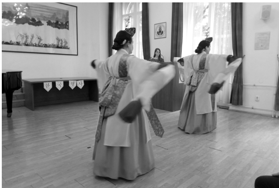
A Mugunghwa táncgyűttes előadása.

Az I. koreai fesztivál ötlete a tanszék oktatóiban fogalmazódott meg a COVID-időszak utáni élő oktatás újraindításának az örömére. Céljuk az volt, hogy összehozzák a koreai szak különböző évfolyamaira járó hallgatóit, különös tekintettel az egyetemet a karantén időszaka alatt elkezdő fiatalokra, hogy interaktív, színes programok keretében személyesebb formában ismertessék meg velük a koreai kultúra különböző területeit.