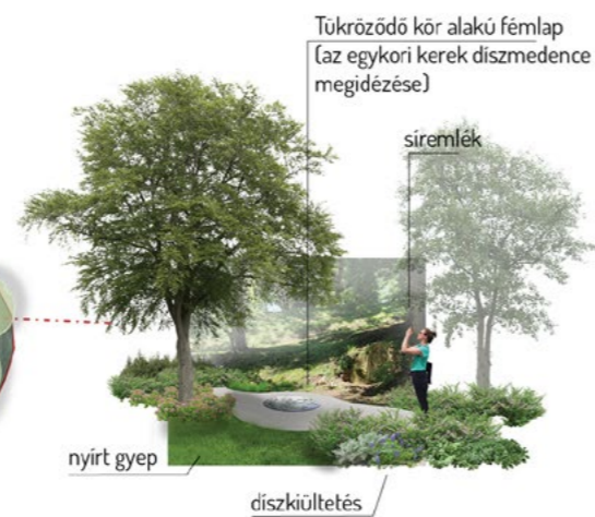
1. A Bethlen-családi síremlék környezete Surroundings of the Bethlen family tomb