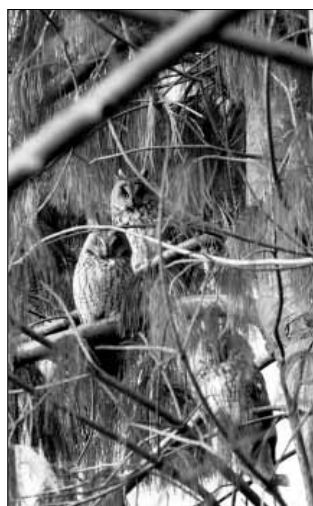
A sarkadi város háza belső udvarán álló fenyőfákon 8-10 erdei fülesbagoly „nappalozik” rendszeresen

ban résztvevők a megszokott MAP felületet használhatják, a Projekt mezőben a TASIOTU kódot (televő erdei fülesbaglyok felmérése) alkalmazva.