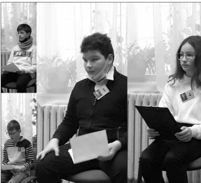
5-6. osztályos korcsoport helyezettjei

A Kazinczy-díj Alapítvány Bizottsága idén is meghirdette a „Szép Magyar Beszéd” versenyt, melynek célja az ifjúság anyanyelvi nevelése, a beszédkultúra javítása. A sarkadi Városi Könyvtár ebben az évben is vállalta a területi forduló lebonyolítását