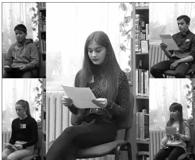
7-8. osztályos korcsoport helyezettjei