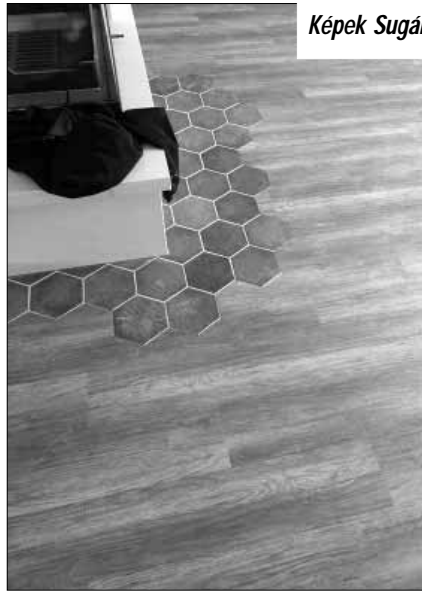
Képek Sugárék munkáiból

1 drb. tégláról, 1 000 Ft egyezer Ft értékben, mely összeggel a sarkadi iparos olvasókör nagytermének felépítéséhez készségesen hozzájárultam. Sarkad, 1926. november hó 1.