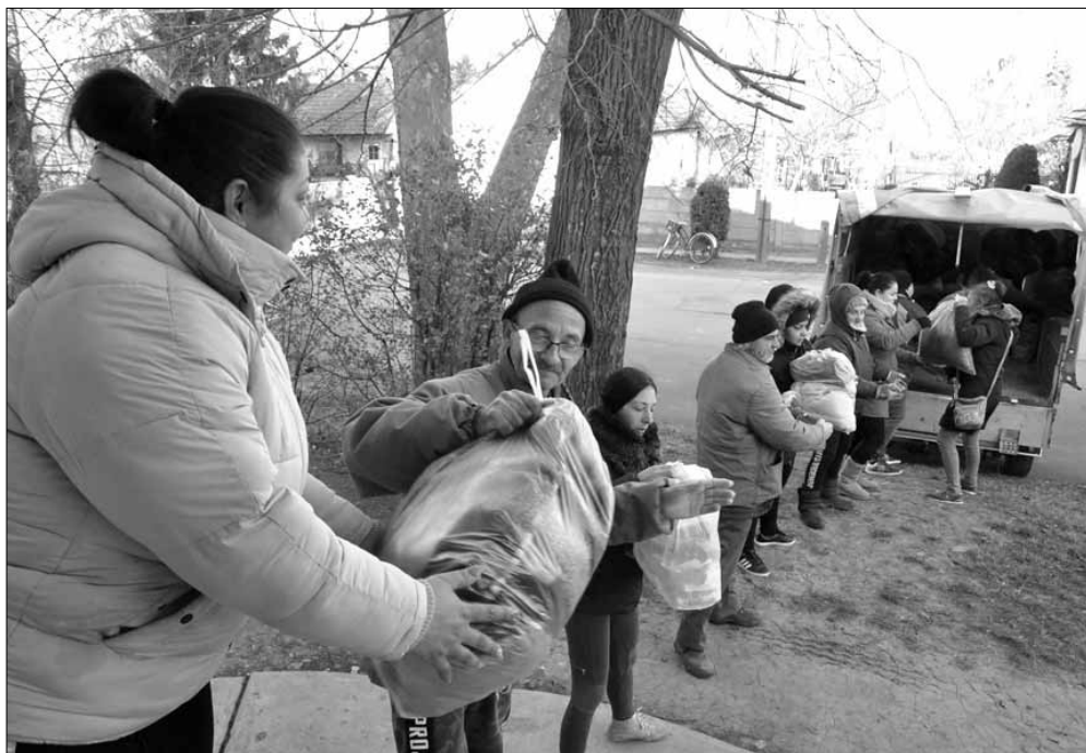
Csütörtök reggel szállítójárművekre rakták a küldeményt és a délelőtti órákban útra is keltek

Az összegyűjtött adományt célzottan, nemzetközi humanitárius munkát végző karitatív szervezettel, nevezetesen