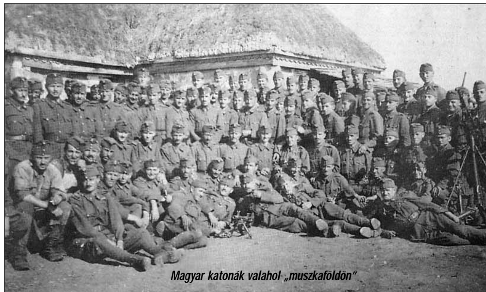
Magyar katonák valahol „muszkaföldön”