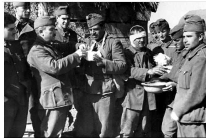
Beállított tábori „pillanatkép” magyar katonák egészségügyi ellátásáról a Don-kanyar táján...

Az 1990-es évek eleje óta január 12-e környékén évről évre előkerül egy igen érzékeny történelmi téma. Egy olyan történelmi téma, amivel a rendszerváltást követően nemcsak a történészek foglalkozhatnak kutatóintézetek szobáiba és levéltárakba zárkózva, hanem az egész nemzet, a nagy nyilvánosság is. Fontos téma ez, mert szinte valamennyi magyarországi települést érint, szinte minden család felmérései között akad olyan, aki ott volt, vagy egy közeli szeretője, ismerőse osztályrészét jutott a fagyos pokol megjárására és bizony nagyon sokan voltak, akik nem jöttek haza... A legszörnyűbb azonban az volt ebben a magyar tragédiában, hogy évtizedekig nem lehetett könnyeket hullatni, nem lehetett virágot, koszorút vinni a sírokra, ugyanis a sírok többségének a pontos helyét sem tudtuk. Beszélni meg végképp nem lehetett róla.