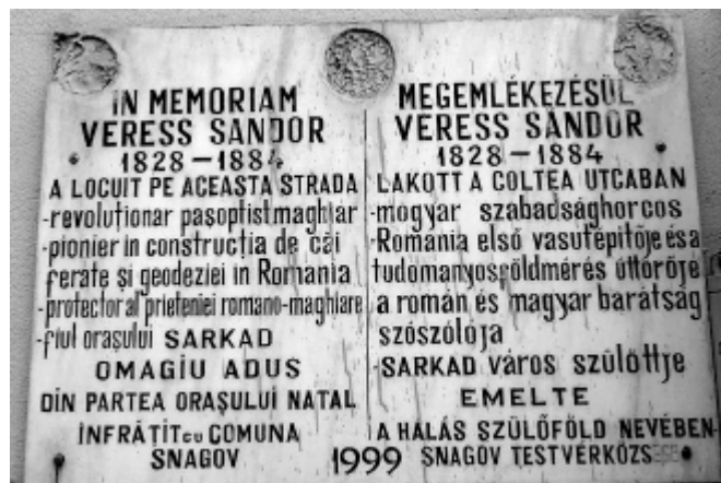
Bukarestben huszonkét évvel ezelőtt Sarkad és Snagov küldöttsége avatta fel ezt az kétnyelvű emléktáblát