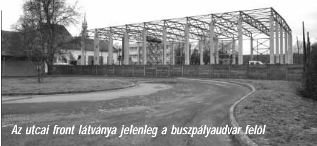
Az utcai front látványa jelenleg a buszpályaudvar felől