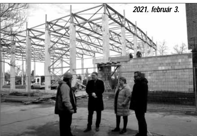
2021. február 3.