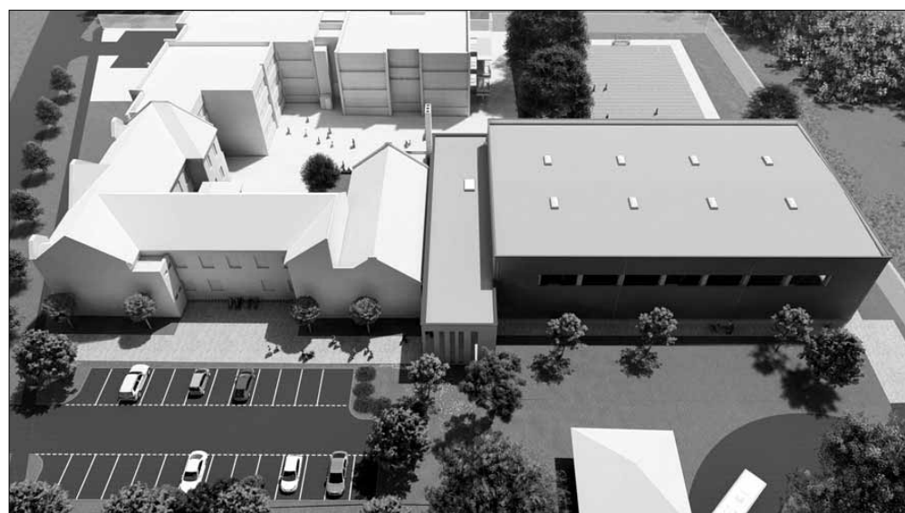
Látványterv a magasból: jobb oldalon az új sportcsarnok

A tanulók mindennapos testnevelési igényeinek teljeskörű kiszolgálására új – könnyűszerkezetes, szendvicspanel burkolattal szerelt, lapostetős – tornacsarnok épül, amely méretét tekintve egy szabványos kézilabda pályát foglal magában és három párhuzamos testnevelés foglalkozás megtartására alkalmas. Az 1.305 m 2 alapterületű tornacsarnok az iskola meglévő telkén kerül felépítésre, a Nagy Imre úttal párhuzamosan, a buszpályaudvar szomszédságában. A létesítménybe így nemcsak az iskola ingatlanon keresztül lehet majd bejutni, hanem tanítási időszakon kívül hétköznapokon és hétvégekenként városi tornacsarnokként is nyitva áll az épületegyüttes az érdeklődők számára, melyben a szabványok előírásainak megfelelő küzdőtér lehetővé teszi számos sportág (kézilabda, labdarúgás, tenisz, röplabda, kosárlabda, stb.) hobbi és versenyszerű folytatását Sarkadon, valamint több városi rendezvény, program, esemény kiváló helyszínéül is szolgál majd. A tornacsarnok épületéhez kapcsolódóan a járdakapcsolatok kialakítására is sor kerül, s a régi bölcsőde épületének tervezett elbontásával, valamint az egymással szomszédos általános iskolai és bölcsődei ingatlanterületek egységesítésével a későbbiekben egy igényesen parkosítható térére szélesedik ki a Nagy Imre út Kosuth utca felőli szakasza, ezzel is tovább szépítve a városközpont arculatát.