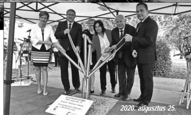
2020. augusztus 25.

Fejlesztési programunkban fontos célkitűzésként határoztuk meg a Kossuth utcai általános iskola fejlesztését is, melynek megvalósításához kiváló lehetőséget teremtett az Emberi Erőforrások Minisztériuma által 2017. tavaszán meghirdetett EFOP-4.1.2-17 „Iskola-2020: Köznevelési intézmények infrastrukturális fejlesztése a hátránykompenzáció elősegítése és a minőségi oktatás megteremtése érdekében” elnevezésű, az általános iskolák székelyintézményeinek infrastrukturális fejlesztését célzó pályázati felhívás. A kiírásra a Sarkadi Általános Iskola fenntartását és működtetését jogszabály erejénél fogva ellátó Gyulai Tankerületi Központ Sarkadi Város Önkormányzatának – mint az általános iskola tulajdonosának – támogatásával nyújtott be pályázatot. Ennek eredményeként – a közös eredményesítő munkának köszönhetően – a fejlesztési programra 1.386.045.361 forint összegű támogatást ítélt meg az Emberi Erőforrások Minisztériumát vezető miniszter és Magyarország Kormánya. Így a 2020. augusztus 25-ei ünnepélyes alapkövetéssel önrő társítása nélkül, 100 %-osan pályázati forrásból indulhatott el a Sarkadi Általános Iskola székelyintézményének infrastrukturális fejlesztése, melynek egyik elemével, nevezetesen az új városi tornacsarnok megépítésével településünk lakosságának egy újabb több évtizedes álmát váltjuk valóra.