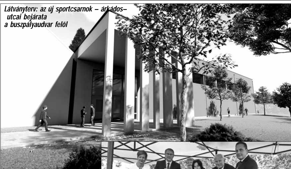
Látványterv: az új sportcsarnok – árkádos-utcai bejárata a buszpályaudvar felől

la tálalókönyvházának felújítását és bővítését is, mely intézményhez korábban parkolókat építettünk.