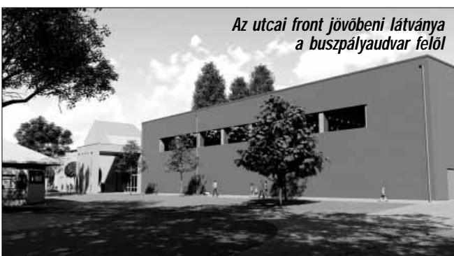
Az utcai front jövőbeni látványa a buszpályaudvar felől