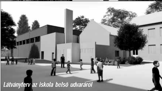
Látványterv az iskola belső udvaráról

idén augusztusban átadásra kerül beruházás eredményeként jelentősen megújul és korszerűsödik a Sarkadi Általános Iskola Kosuth utcai székhelyintézményének infrastruktúrája, korszerű, fejlett körülmények között folytathatják tanulmányaikat a diákok és gyakorolhatják hivatásukat a pedagógusok, valamint megtörténik a minőségi nevelés-oktatás megvalósításához és a mindennapos testnevelés infrastrukturális igényeihez illeszkedő eszközbeszerzések végrehajtása is. A városunk és kistérségünk gyermekeit, fiataljait, valamint felnőtt korú lakosságát is szolgáló, évtizedek óta várt vá-