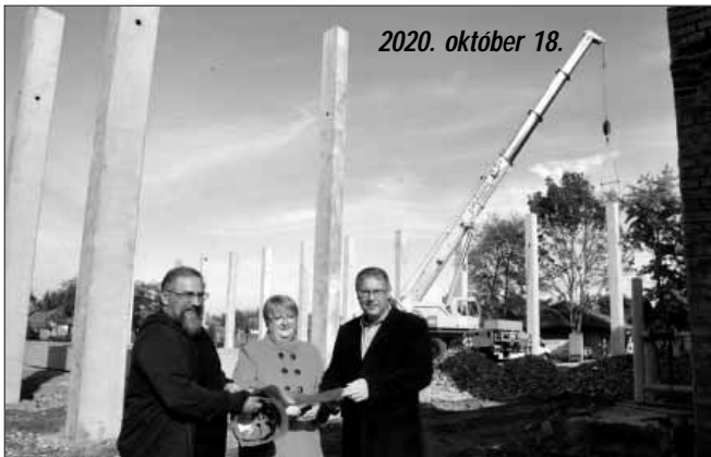
2020. október 18.

gi rendszer készül, valamint korszerű, energiatakarékos, fenntartható fűtési rendszer létesül és a vizesblokkokat is teljes körűen felújítják. Megújul a világítás, energiatakarékos rendszerek alkalmazásával, későbbi napkollektoros/napelemes csatlakozási lehetőség kiépítésével. A meglévő pincefödémét elbontják, s a pincét feltöltik. A főbejárat mellett négy terem összenyitásával aula létesül, míg a tanári terem és néhány tanterem épületen belül átcsoportosításra kerül, a közlekedőterekben és a tantermekben pedig új burkolat készül. A jelenleg meglévő, 205 m 2 -es fél tornaterem – mely még az 1900-as évek első felében létesült – új funkciót fog ellátni. A keleti oldalon egy összekötő folyosó létesül a büfével, a megmaradó helyiség pedig vegyes oktatási funkciót kap (kamaterem). Az északi oldalán lévő földszintes nyúlványokat (gázfogadó, szertár) szintén elbontják és a funkciókat egy új kiszolgáló épületbe telepítik. A meglévő tornaterem melletti belső udvari, földszintes öltöző egy részét elbontják, a megmaradó rész raktárként funkcionál a jövőben. Az épületegyüttesben projektarányos akadálymentesítés valósul meg, az új épületrészben a földszinten akadálymentes öltöző és illemhely létesül, az összes közösségi funkció elérése akadálymentesen biztosítottá válik, valamint egy új akadálymentes gépkocsi parkoló (folytatás a 2. oldalon)