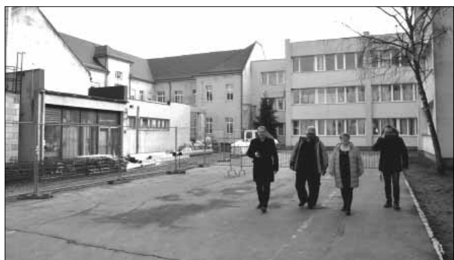
A magastető, kétszintes épületrész eternit palával fedett héjazatát cserepes lemez fedésre cserélik