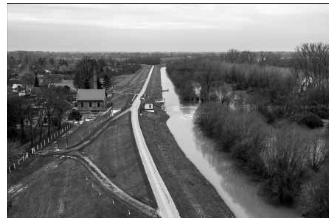
Különböző probléma nélkül távozott a víztömeg térségünkben