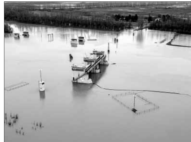
Békésszentandrásnál tetőzött az árhullám. A képen a duzzasztómű

Az elmúlt hétvégén a február hónapra általában nem jellemző méretű árhullám vonult le a Körösökön, tájékoztatták lapunkat a Körösvidéki Vízügyi Igazgatóság szakemberei.