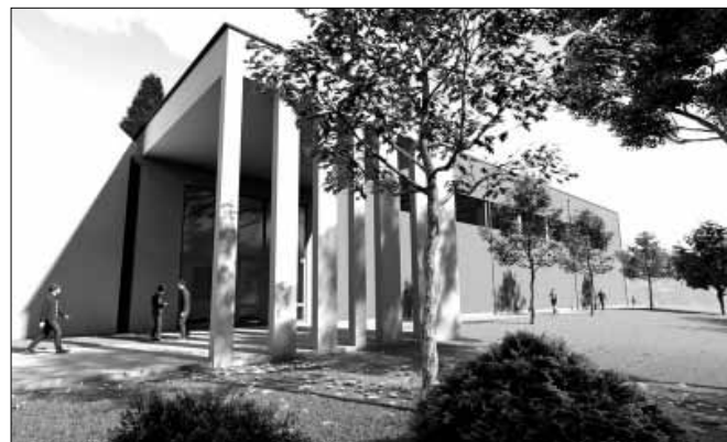
Látványtervek: az új sportcsarnok árkádos utcai bejárata a buszpályaudvar felől

A projekt keretében a magastető, kétszintes épületrész fedését cserepes lemez borításra cserélték a víz-zárás és a súlycsökkentés