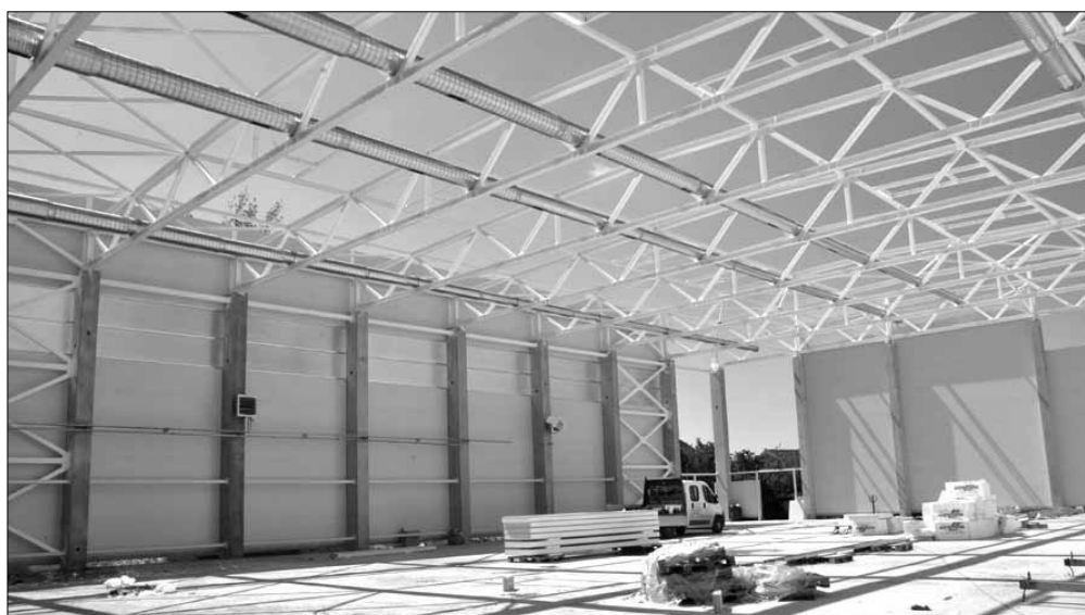
A csarnok oldalfalának elemeit már a vázszerkezetre szerelték

Képrportjainkkal a későbbiekben is folyamatosan be fogunk számolni az építkezés fontosabb állomásairól, annak érdekében, hogy ezen impozáns beruházás minden fontosabb, látványosabb pillanata látható legyen, melynek során teljesen megújul Sarkad egy meghatározó oktatási intézménye. -mk