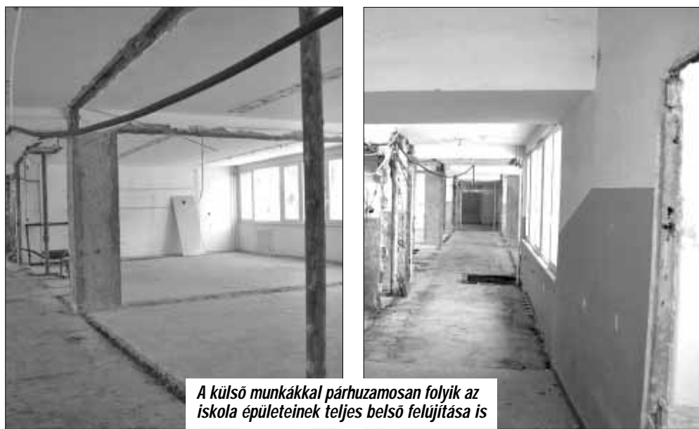
A külső munkákkal párhuzamosan folyik az iskola épületeinek teljes belső felújítása is