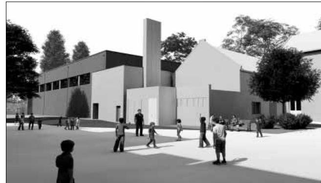
A szabadtéri sportudvar kialakítása