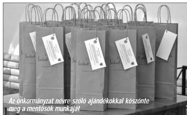
Az önkormányzat névre szóló ajándékokkal köszönte meg a mentősök munkáját

Az állomásvezető megköszönte az önkormányzat segítségét, illetve köszönetet mondott azért is, hogy a városvezetés még télen jelentős támogatást nyújtott a sarkadi állomás kifestéséhez. Azt is hozzátette, hogy a Mentők Napja alkalmából sok gyermek is el szokott látogatni a sarkadi állomásra, amire idén nem kerülhetett sor, de őszintén reméli, hogy jövőre újra gyermekszivaltyól lehet hangos a sarkadi mentőállomás huszadik évét betöltő épülete a Mentők Napja alkalmából, mert az nemcsak a jeles évfordulót, hanem a pandémia végét is jelentheti! -mk