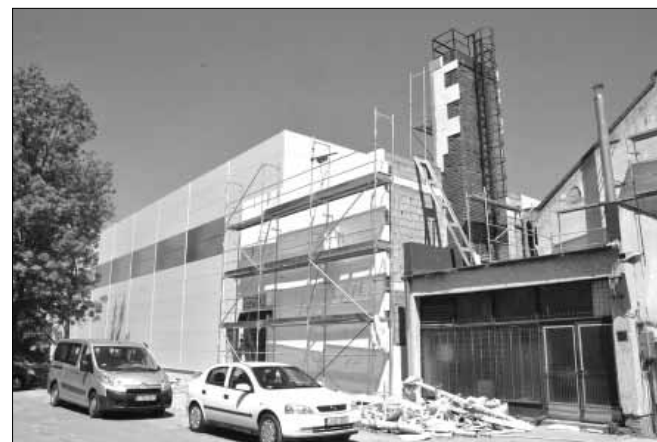
Az építkezés jelenlegi képe és a majdani: látványterv az iskola belső udvaráról (alsó kép)

A tanulók mindennapos testnevelési igényeinek teljeskörű kiszolgálására új tornacsarnok épült, amely méretét tekintve egy szabványos kézilabda pályát foglal magában és három párhuzamos testnevelés foglalkozás megtartására alkalmas. Az 1.305 m 2 alapterületű tornacsarnokba azonban nemcsak az iskola ingatlanán keresztül lehet majd bejutni, hanem tanítási időszakon kívül hétköznapiakon és hétvégenként városi tornacsarnokként is nyitva áll az épület együttes az érdeklődők számára, melyben a szabványok előírásainak megfelelő küzdőtér lehetővé teszi számos sportág (kézilabda, labdarúgás, tenisz, röplabda, kosárlabda, stb.) hobbi és versenyszerű folytatását Sar-