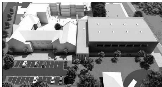
Látványterv a magasból: jobb oldalon az új sportcsarnok

céljából. Folyamatban van a teljes épületgyűttes gépészeti, fűtési és épületvillamosági rendszereinek cseréje, a vizesblokkok teljes körű felújítása. A meglévő pincéfödémét elbontották, a pincét már feltöltötték. A főbejárat melletti termek összenyitásával elkészült szerkezetkész a hatalmas aula, a tantermekben az új burkolat már készül. A jelenleg meglévő, 205 m 2 -es fél tornaterem – mely még az 1900-as évek első felében létesült – új funkciót fog el látni. A keleti oldalán egy összekötő folyosó létesül büfével, a megmaradó helyiség pedig vegyes oktatási funkciót kap, kamaraterem lesz. A korábbi gázfogadót és a szertárakat már elbontották, funkcióikat az új kiszolgáló épületbe telepítik. A meglévő tornaterem melletti belső udvari, földszintes öltöző egy részét elbontották, a megmaradó rész raktárként funkcionál a jövőben. Az épületgyűttesben projektarányos akadálymentesítés valósul meg, az új épületrészben a földszinten akadálymentes öltöző és illemhely létesül, az összes közösségi funkció elérése akadálymentesen biztosítottá válik, valamint egy új akadálymentes gépkocsi parkoló is létesül az iskola főbejáratánál.