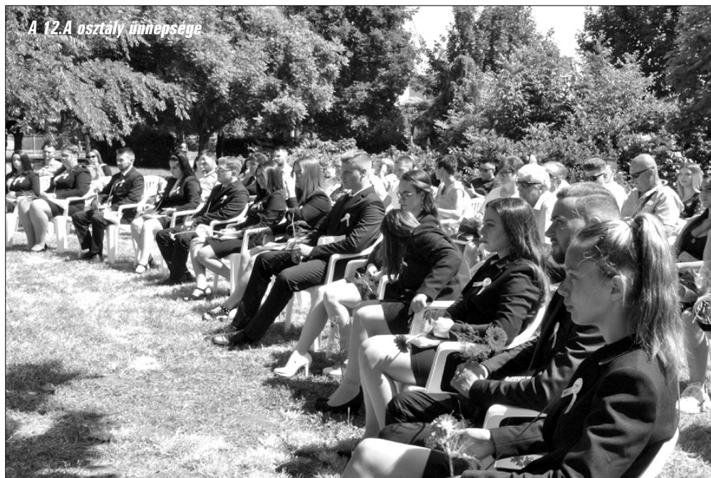
A 12.A osztály ünnepsége

Az Ady Endre – Bay Zoltán Gimnázium vezetése valamelyest kárpótolva a végzősöket, ünnepélyes keretek között rendezett érettségi bizonyítvány átadást. A 12.A osztály végzősei június 18-án, míg a 12.C osztály végzősei június 24-én vehették át bizonyítványaikat. Ezekre az ünnepségekre a végzős diákok vendégeket is hívtak, továbbá a bizonyítványok