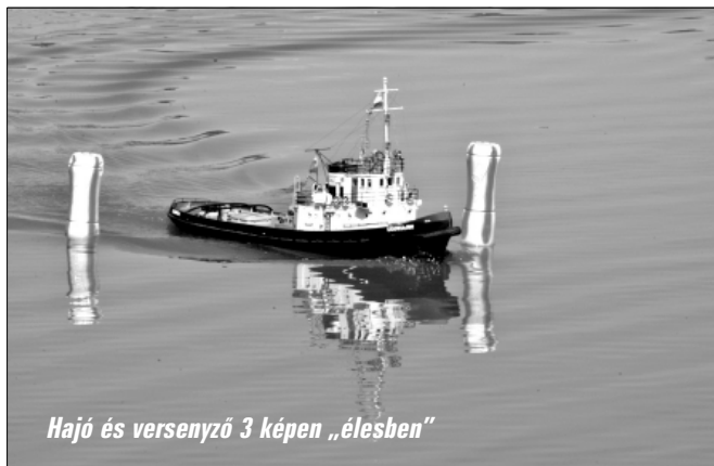
Hajó és versenyző 3 képen „élesben”

A Gyomaendrődi Székely Mihály Hajómodellező és Sportklub, valamint Plank László vezette Sarkadi Hajómodellező Szakkör tizenöt éve rendez hójómodell versenyeket a sarkadi Éden-tavon. Az elmúlt évben mint annyi mást az életünkben ezt is törölte az egészségügyi járvány, ám az idén nem. Június 12-én Naviga elnevezésű országos bajnokságot rendeztek meg Sarkadon, mely egyben a Nemzeti Bajnokság része is volt. Népes mezőny gyűlt össze