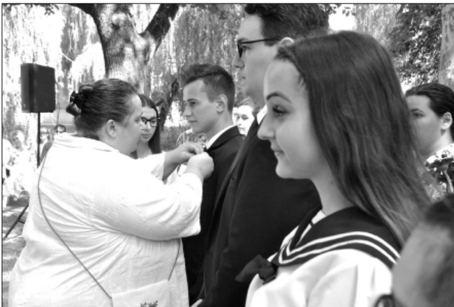
Szalagtűzés a 12.C osztály ünnepségén