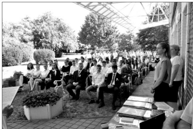
A Gyulai Szakképzési Centrum Ady Endre – Bay Zoltán Szakképző Iskola évzáró ünnepségén