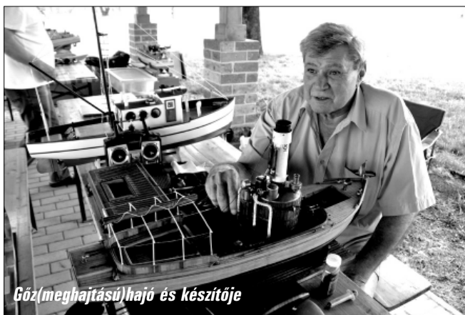
Gőz(meghajtású)hajó és készítője