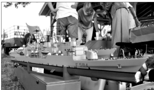
Az olasz hadiflotta Bersagliere elnevezésű fregattjának 1:100 léptékű kicsinyített és úszóképes mása. (fregatt: 600t alatti súlyú hadihajó)

ezen a napon a meghirdetett kategóriákban (NS F2A, Egyéb, ETC - Egyéb, NS F2B, NS F2C, NS F4A, NS F4B, NS F4C, NS FDS-A EXPERT) és még a kora esti órákban is folyt a vetélkedés.