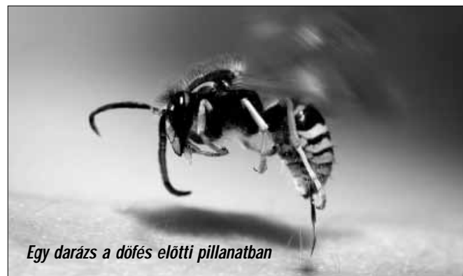
Egy darázs a dőfés előtti pillanatban