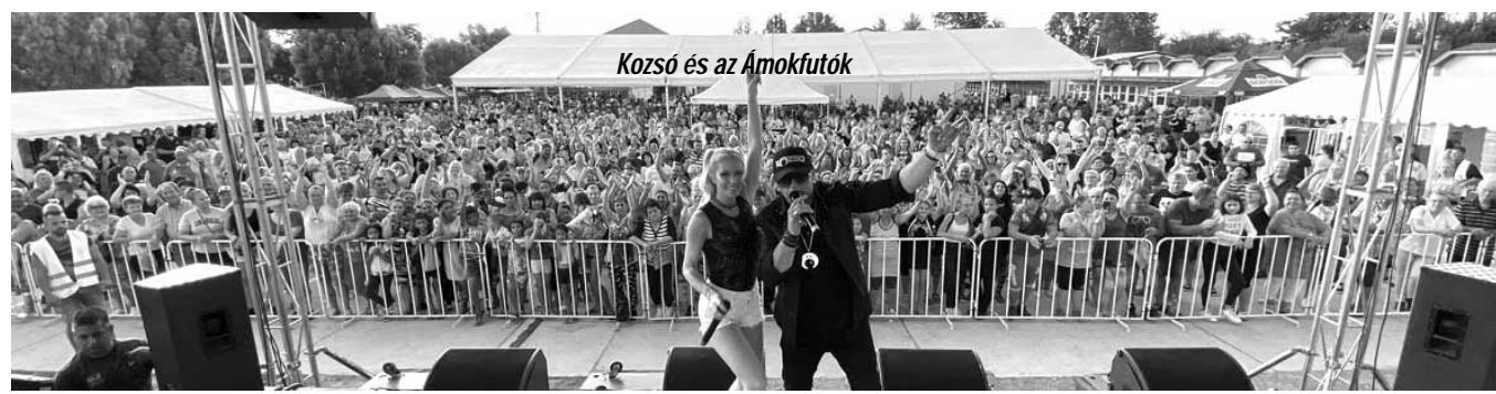
Kozsó és az Ámokfutók