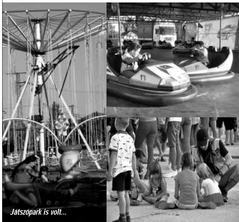
Játsszópark is volt...