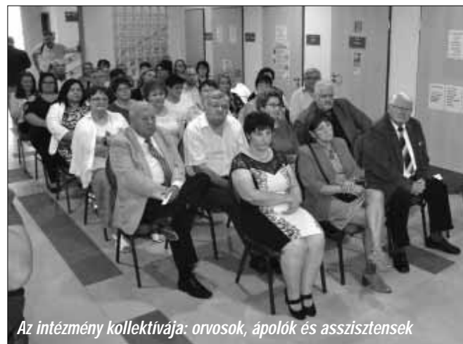
Az intézmény kollektívája: orvosok, ápolók és asszisztensek