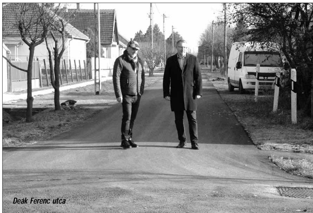
Deák Ferenc utca

Az önkormányzati tulajdonú lakóutakat illetően természetesen Sarkad Város Önkormányzatának fejlesztési programjában kiemelt célkitűzésként szerepel a meglévő aszfaltburkolatú önkormányzati utak felújítása, valamint a jelenleg még csak útalappal rendelkező önkormányzati utak szilárd burkolattal történő ellátása. Azonban ezeket a célkitűzéseket a települési önkormányzatok nem képesek saját forrásból megvalósítani, tekintettel arra, hogy egy már aszfalt-