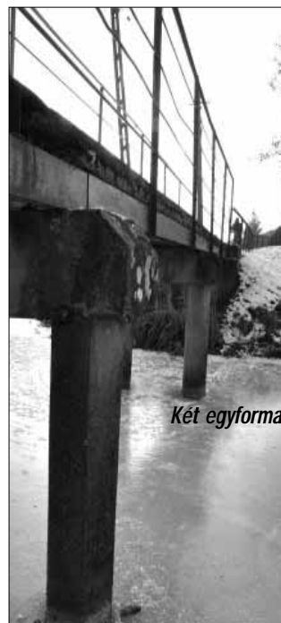
Két egyforma gyaloghíd a Zöldfa- és a Rózsa utcában