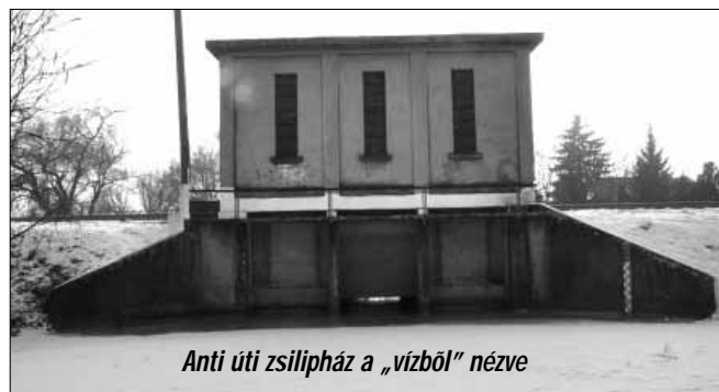
Anti úti zsilipház a „vízből” nézve