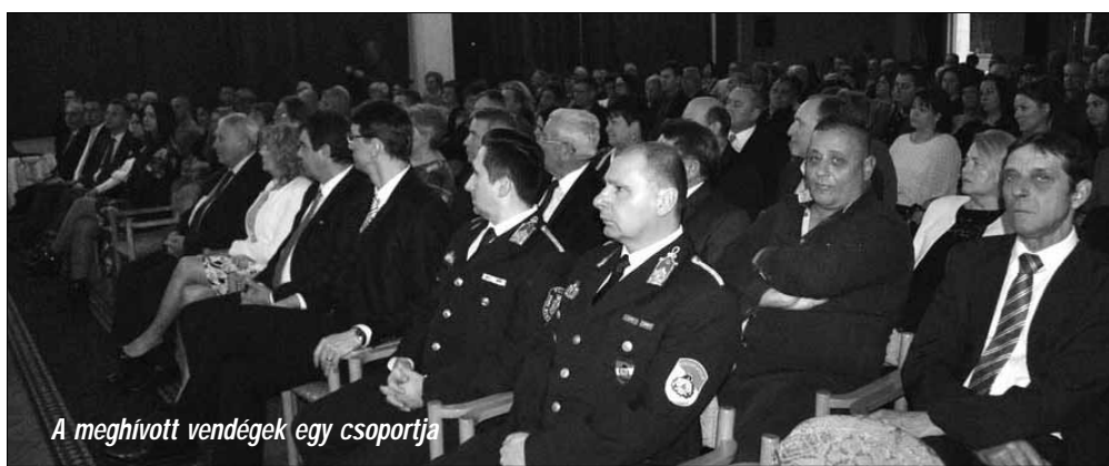
A meghívott vendégek egy csoportja