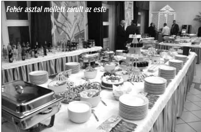
Fehér asztal mellett zárult az este