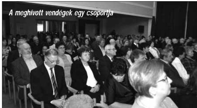
A meghívott vendégek egy csoportja