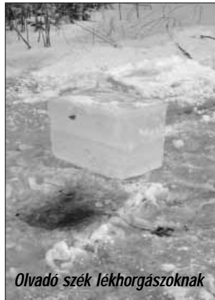
Olvadó szék lékhorgászoknak