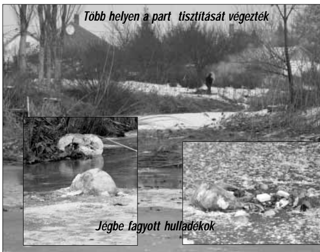
Jégbe fagyott hulladékok