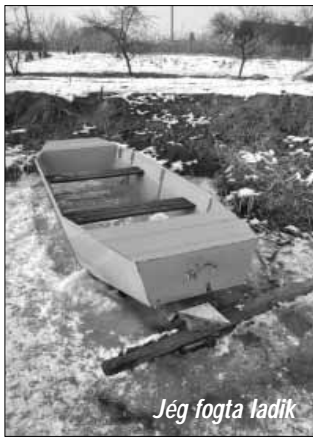
Jég fogta ladik