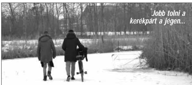
Jobb tolni a kerékpárt a jégen...