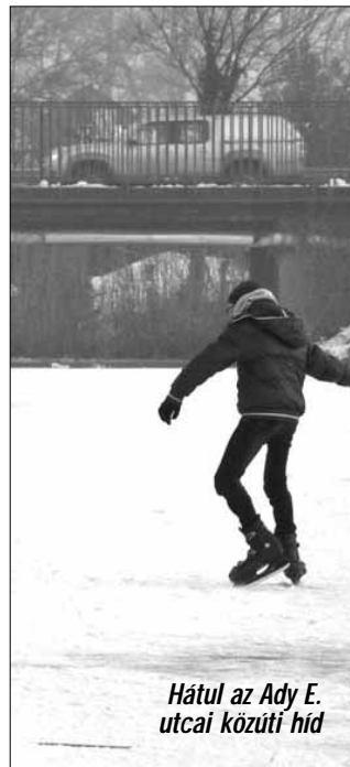
Hátul az Ady E. utcai közúti híd