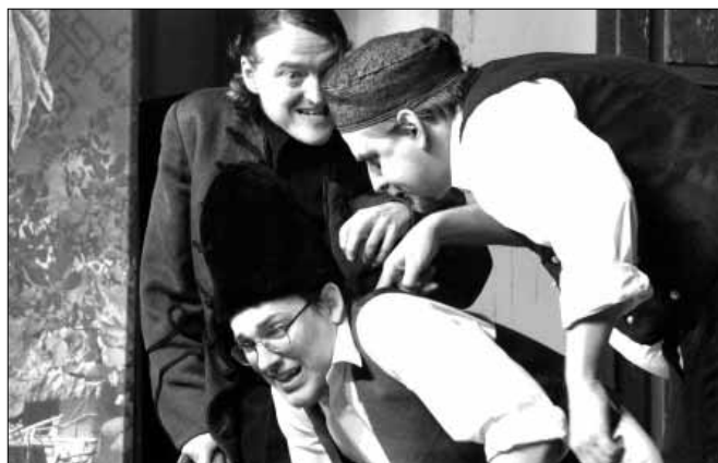
Az idén a budapesti Körúti Színház két felvonásos, „A vén bakancsos és a fia, a huszár” című darabját tekinthették meg a vendégek