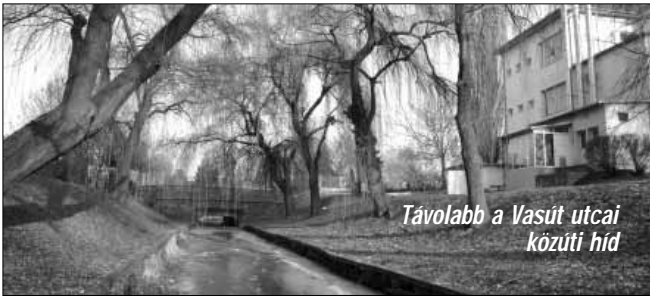
Távolabb a Vasút utcai közti hid