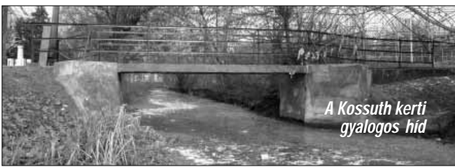
A Kossuth kerti gyalogos hid