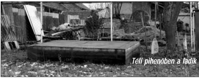
Téli pihenőben a ladik