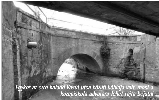
Egykor az erre haladó Vasút utca közti köhidja volt, most a középiskola udvarára lehet rajta bejutni

A levegő lehűlésének köszönhetően ezen a télen is átalakultak természetes vizeink. Közel két hétig borította a jég a tavakat, csatornákat itt-ott sportolásra is alkalmas vastagságban. Viszont Sarkad területén biztonságos közlekedésre régen nyújtott lehetőséget és rálépni - vagy járni rajta - még ekkor sem sokan vállalkoztak. Pedig akadt érdekes látványos fagypontra, a kertek alatt. Legalább is olyan, amit máskor legfeljebb „vízenjárva” vehetnénk szemügyre. —kas