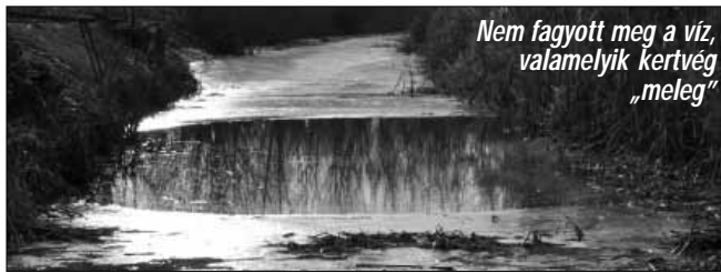
Nem fagyott meg a víz, valamelyik kertvég „meleg”