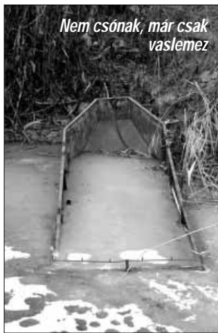
Nem csónak, már csak vaslemez