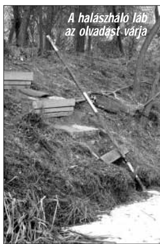
A halászháló láb az olvadást várja