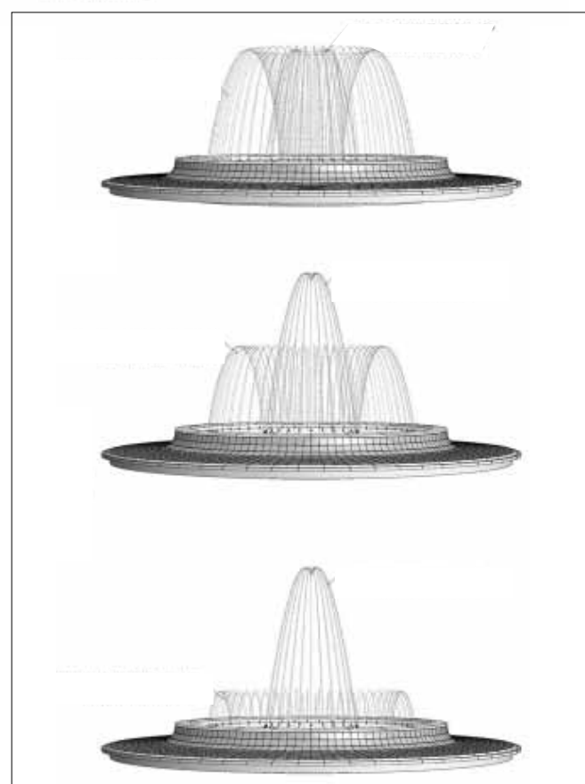
Terrajz a vízkép változásairól ötvenszeres kicsinyítésben

A támogatás összegét a Békés-Bihar Kistérség Fejlesztő Egyesület által az OTP Bank Nyrt.-nél vezetett 11733175-20004862-00000000 számú bankszámlára lehet befizetni a „Sarkad, Anti és Gyulai úti díszkút támogatása” közleménnyel. (Mivel az egyesület közhasznú jogállású, így a támogató vállalkozó mellett, hogy a támogatás összegét költségként elszámolhatja, a társasági adóról szóló 1996. évi LXXXI. törvény 7. §