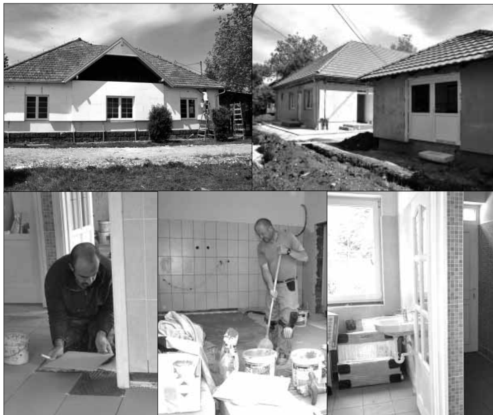
A Gyulai úti általános iskola tállókönyhájának és ebédlőjének teljes felújítása és bővítése

egy új, közösségi térként funkcionáló, modern és szabványos játszótér kerül kialakításra. Természetesen tovább folytatódik a városi piac fejlesztése, a tavaszra már elkészült, impozáns új csarnok mellé egy új, kétszintes kiszolgáló épület épül irodákkal, hűtőházzal és új mellékhelyiségekkel, valamint új parkoló is létesül elektromos gépkocsi töltővel, de megújulnak az elárúsító asztalok is. Hamarosan kezdődik a Városgazdálkodási Iroda Sarkadkeresztúri úti településének a fejlesztése is, ahol egy új ipari csarnok és iroda-szociális épületépítés, de megújul a településhálózat és a parkolók is. Az óvodák további fejlesztése kerekében sor kerül a Kossuth utcai óvoda energetikai korszerűsítésére, valamint egy újabb, jelentős közlekedésfejlesztési beruházással is gazdagodik a város, mert új aszfaltburkolatot kap a Zsarói utca.