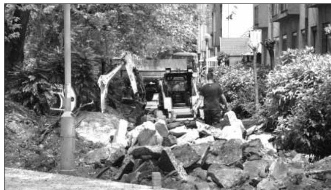
A Béke sétány felújítása során közel egymillió darab burkoló követ tesznek majd le a kivitelező dolgozói

Alapterülete összesen 205,85 m 2 lesz. A projekt keretében épült egy új, szabadon álló, egyterű, földszintes, hagyományos szerkezetű, magastetős raktárépület is, melynek hasznos alapterülete 21 m 2 . Áprilisban látott hozzá a kivitelező városunk egyetlen sétáló utca jellegű közterületének, a leromlott állagú, önkormányzati tulajdonú Béke sétány, mint meglévő közösségi tér felújításának és funkcióbővítésének. A fejlesztés során a Béke sétány jelenlegi egyenes nyomvonalát a templom melletti első épülettömb környezetében módosul, míg a gyógyszerártnál és az orvosi rendelőnél található csomópontokban terek kerülnek kialakításra. (folytatás a 2. oldalon)