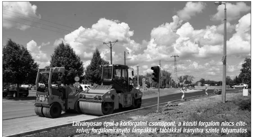
Látványosan épül a körforgalmi csomópont, a közúti forgalom nincs elterelve, forgalomirányító lámpákkal, táblákkal irányítva szinte folyamatos

Szintén tavasszal kezdődött és jól halad a Gyulai úti általános iskola tálalókonyhájának és ebédlőjének teljes felújítása és bővítése. A projekt keretében a tálalókonyha és étterem épületének átalakítása és egy új épületrésszel való bővítése zajlik mintegy 90 millió forintból. Az étterem a meglévő épületrészben kap majd helyet, míg a melegítő-tálaló konyha helyiségei, valamint a szociális és kiegészítő helyiségek az új bővítményben kerülnek kialakításra. Az átalakítást és bővítést követően kialakuló épület hasznos