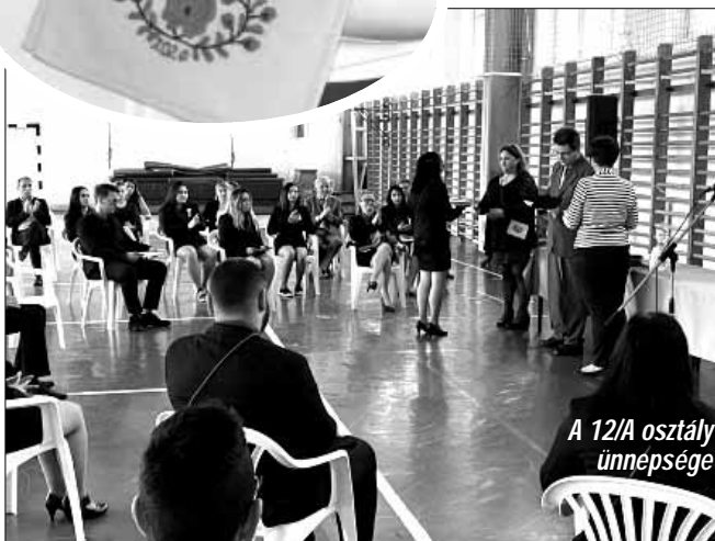
A 12/A osztály ünnepsége