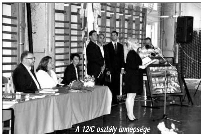
A 12/C osztály ünnepsége