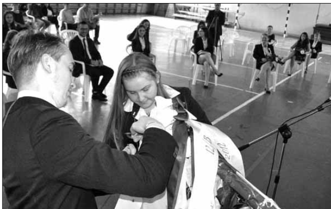
Mindkét érettségiző osztály diákjai szalagot tűztek az iskola zászlajára