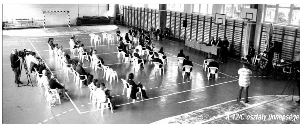
A 12/C osztály ünnepsége

A 12/C osztály érettségi bizonyítvány átadó ünnepségére az elmúlt héten pénteken, a 12/A osztályra e-hét kedden került sor az iskola tornacsarnokában. Mindkét ünnepségen egyenként szólították az ünneplőbe öltözött érettségizőket, majd az ünnepségek elején az érettségielnökök ismertették a vizsgaeredményeket, külön is kiemelve a szép teljesítményt nyújtó tanulókat. A 12/A osztály érettségielnöke