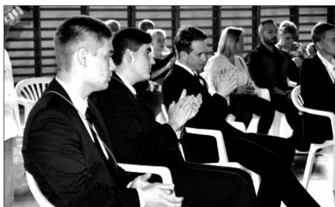
A 12/C osztály ünnepsége