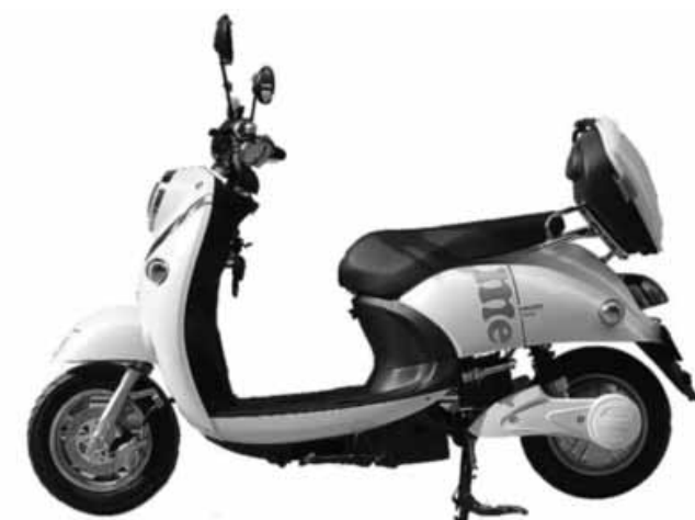
Ennek az elektromos robogónak nincs pedálja és 1000 W a motor teljesítménye, következésképpen segédmotoros kerékpár

– KRESZ 4.§ (1) bek. a) pont: „Járművet az vezet-