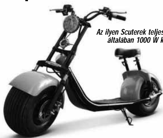
Az ilyen Scuterek teljesítménye általában 1000 W körül van

A KRESZ-nek a kerékpár fogalmában használt „emberi erő hajt” kifejezése azt jelenti, hogy kerékpárnak kizárólag az olyan eszköz tekinthető, amelyet a saját hajtószerkezete működtetésével (hajtásával) készítenek mozgásra az azt vezető ember. A kerékpár rendeltetészerű használatához az emberi erő kifejtése elengedhetet-