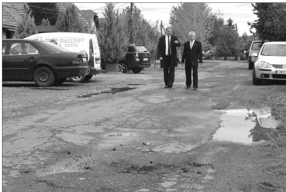
A Jókai utcai közút jelenlegi leromlott állapotában

Huszonötmillió forintból valósul meg a beruházás