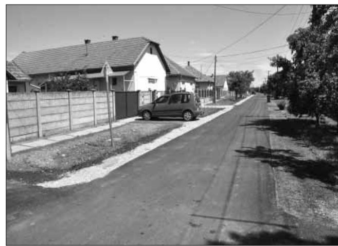
Fél éven belül a Jókai utcai út is a Mátys és a Zsarói utcaihoz hasonló, jó minőségű aszfaltburkolatot kap