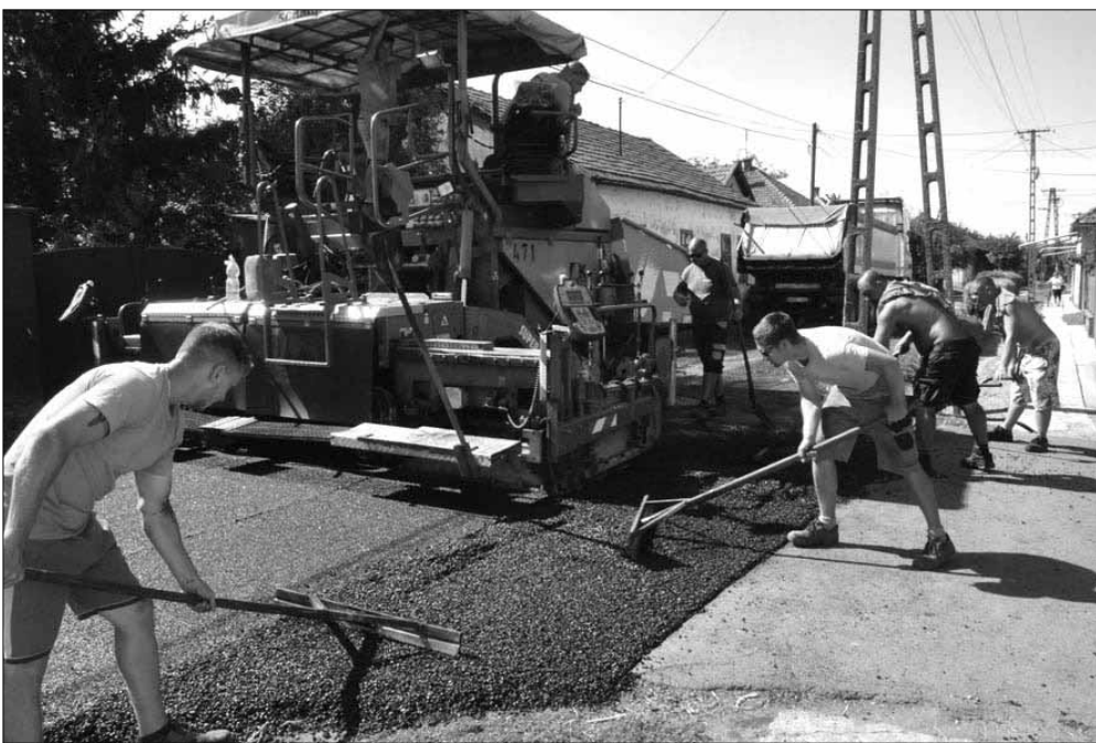
A Zsarói utca aszfaltozási munkálatai