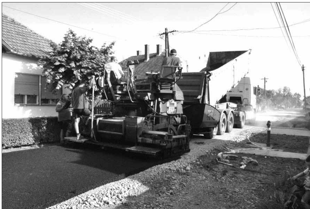
A Mátys utca aszfaltozási munkálatai

A beruházáshoz kapcsolódó közbeszerzési eljárást a téli hónapokban folytatja le