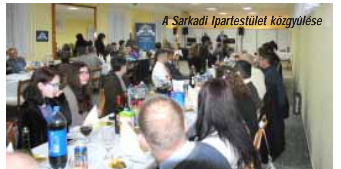
A Sarkadi Ipartestület közgyűlése