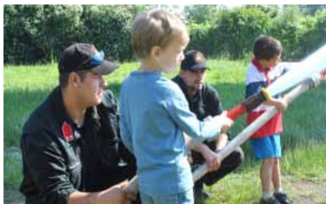
Már hatodik éve önállóan is beavatkozhatnak a sarkadi önkéntes tűzoltók, akik népszerűek a gyerekek körében is