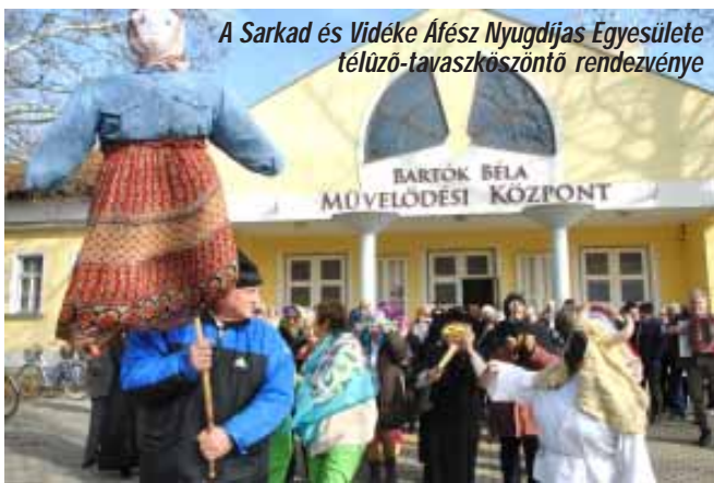
A Sarkad és Vidéke Áfész Nyugdíjas Egyesülete télüzü-tavaszköszöntő rendezvénye