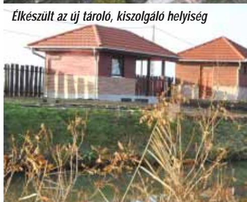
Elkészült az új tároló, kiszolgáló helyiség

Folyamatos az Éden Camp fejlesztése, nyáron már több eseménynek is otthont adott a szigeten épített rendezvénycsarnok, amihez modern vizes-blokk csatlakozik, de már a szigetre átvezető új hidak elemei is megérkeztek. A tábor főépülete mellé új konyha és étkező épült, két szoba komfortfokozata emelkedett, rendezvénysátor került telepítésre, napjainkban pedig egy újabb tároló, kiszolgáló egység is megépült.