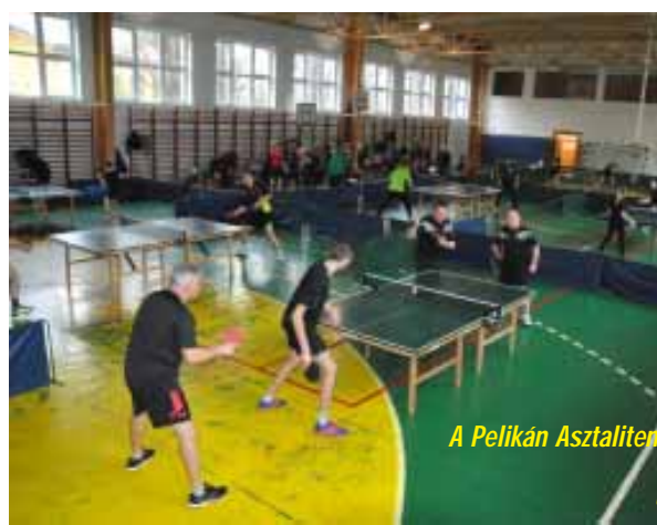
A Pelikán Asztalitenisz Sportklubnak köszönhetően népszerű sportág az asztalitenisz. Minden évben több bajnokságnak is otthont ad a város