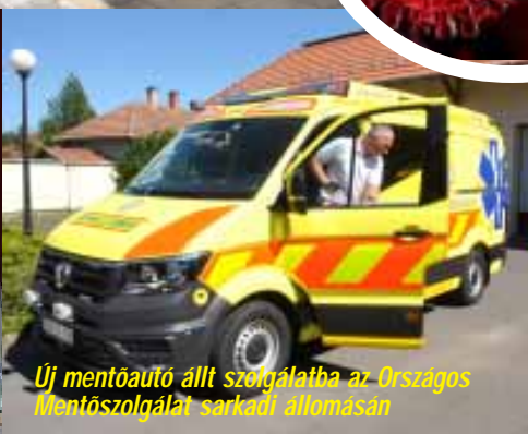
Új mentőautó állt szolgálatba az Országos Mentőszolgálat sarkadi állomásán