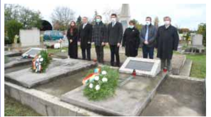
Magyar és román katonasírok megkoszorúzása a Szigeti temetőben a Mindenszentek alkalmából a Gyulai Román Fokonzultus vezetőinek jelenlétében