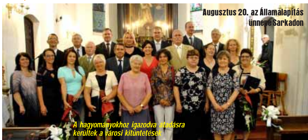
Augusztus 20. az Államalapítás ünnepe Sarkadon