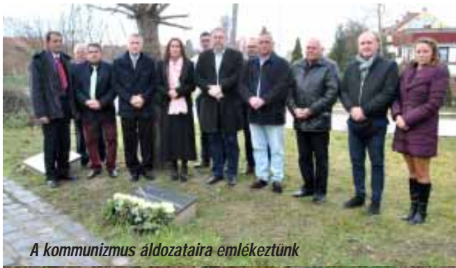
A kommunizmus áldozataira emlékeztünk