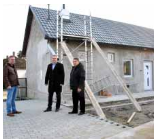
A Sarkadi Ipartestület szintén egy, az önkormányzattal közösen megvalósított pályázat révén újítja fel és építi át új székházát a Kossuth utcán. A beruházás értéke meghaladja a 11 millió forintot