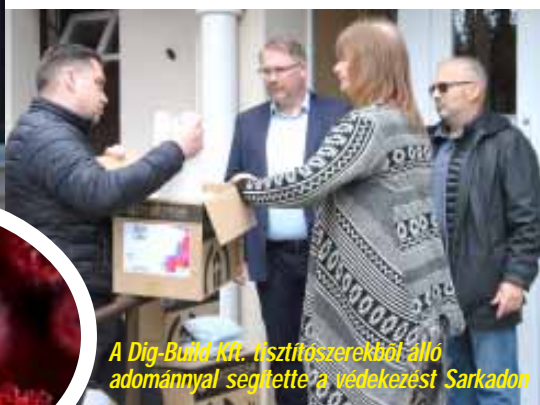
A Dig-Build Kft. tisztításhoz szükséges eszközökkel segítette a védekezést Sarkadon

A hazánk életét és mindennapjainkat március óta felforgató koronavírus-járványról hamar kiderült, hogy leginkább az idős, krónikus betegséggel, vagy adott esetben krónikus betegségekkel küzdő embertársainkra jelenti a legnagyobb veszélyt. A koronavírus-járvány elleni küzdelemből önkormányzatunk is kiveszi a részét egy sor intézkedés meghozatalával, az arra rászorulóknak segítségével. A védekezés keretében a Magyar Honvédség fertőtlenített a sarkadi intézményekben is, de az önkormányzat is fertőtleníti a sokak által használt közterületeket.