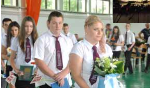
Rendhagyóak voltak az idén a ballagások és az évvitók