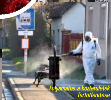
Folyamatos a közterületek fertőtlenítése