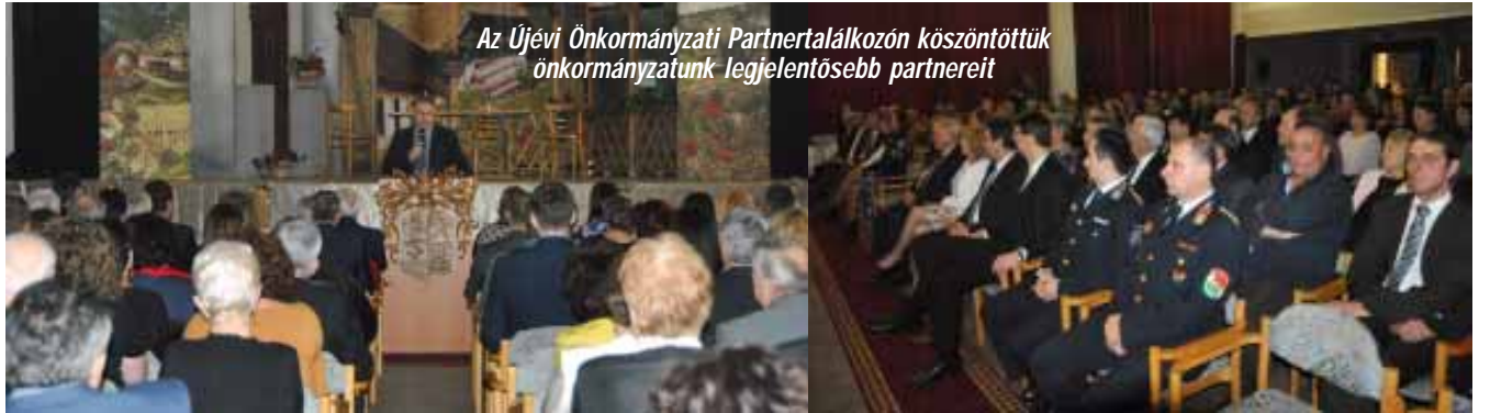
Az Újévi Önkormányzati Partnertalálkozón köszöntöttük önkormányzatunk legjelentősebb partnereit