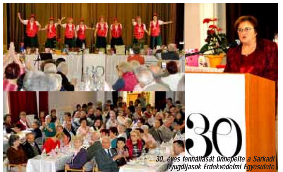
30. éves fennállását ünnepelte a Sarkadi Nyugdíjasok Érdekvédelmi Egyesülete