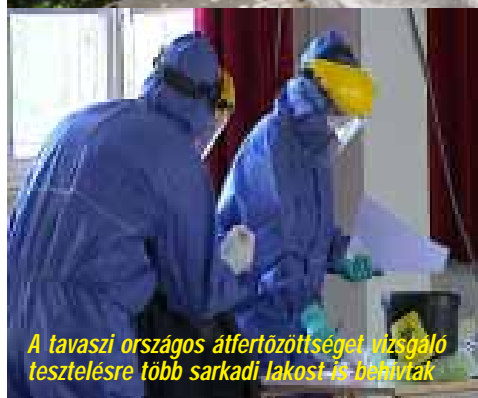
A tavaszi országos átfertőzöttséget vizsgáló tesztesetre több sarkadi lakost is bevittek

A hazánk életét és mindennapjainkat március óta felforgató koronavírus-járványról hamar kiderült, hogy leginkább az idős, krónikus betegséggel, vagy adott esetben krónikus betegségekkel küzdő embertársainkra jelenti a legnagyobb veszélyt. A koronavírus-járvány elleni küzdelemből önkormányzatunk is kiveszi a részét egy sor intézkedés meghozatalával, az arra rászorulóknak segítségével. A védekezés keretében a Magyar Honvédség fertőtlenített a sarkadi intézményekben is, de az önkormányzat is fertőtleníti a sokak által használt közterületeket.