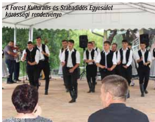
A Forest Kulturális és Szabadidős Egyesület közösségi rendezvénye