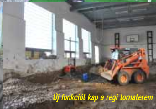
Új funkciót kap a régi tornaterem