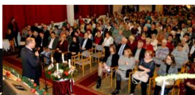
A 2019 decemberében megtartásra került az Idősek Karácsonya, majd a karácsonyi testületi ülés keretében a képviselők megajándékoztak nehezebb sorsú lakosokat. Idén sajnos ilyen ünnepségekre nem kerülhet sor