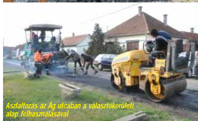
Aszfaltozás az Ág utcában a választókerületi alap felhasználásával

Egy Belügyminisztérium által kiírt pályázat megnyerésének köszönhetően történt meg az önkormányzati fenntartású Zsarói utca útburkolatának újjáépítése a Sirály és Kastély utcák közötti szakaszon, 990 méter hosszban. A 30 millió forint állami támogatás mellé 5 millió forint önkormányzati önerő társult. A következő újjáépítésre kerülő utca a Jókai lesz 2021 tavaszán.