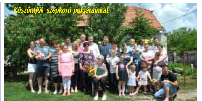
Köszöntjük szépkorú polgárainkat