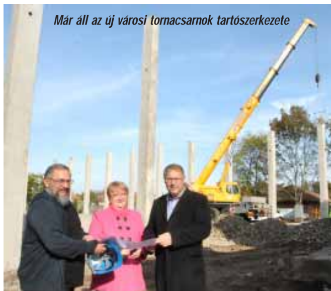
Már áll az új városi tornacsarnok tartószerkezete

A Kossuth utcai Általános Iskola teljeskörű felújítására és a hozzá kapcsolódó, új városi tornacsarnok építésére a Sarkadi Általános Iskola fenntartását és működtetését jogszabály erejénél fogva ellátó Gyulai Tankerületi Központ, Sarkad Város Önkormányzatának – mint az általános iskola tulajdonosának – támogatásával nyújtott be pályázatot. Ennek eredményeként – a közös érdekérvényesítő munkának köszönhetően – a fejlesztési programra 1.386.045.361 forint összegű támogatást ítélt meg Magyarország Kormányja. Ebből a forrásból teljesen megújult a Kossuth utcai Általános Iskola épülete, felépül az új, városi tornacsarnok, valamint jelentős eszközbeszerzésre is sor kerül.