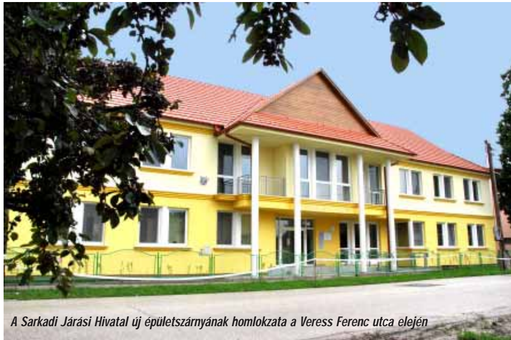
A Sarkadi Járási Hivatal új épületszárnyának homlokzata a Veress Ferenc utca elején

600 millió forint értékű, hazai forrásból finanszírozott projekt keretében épült meg a nyáron a Sarkadi Járási Hivatal új épülete a régi, de teljesen felújított épület mellé. A beruházásnak köszönhetően a sarkadiak, illetve a Sarkadi Kistérség településeinek élők, valamint a határ másik oldalán élő nemzettestvéreink is kényelmes, európai körülmények között juthatnak hozzá a legmodernebb közigazgatási szolgáltatásokhoz a Szent István téren. A korábbi, 700 négyzetméteres, több ütemben fejlesztett hivatali épületet egy folyosó köti össze az 1.300 négyzetméteres új szárnyal. A fejlesztésnek köszönhetően egy több, mint 2.000 négyzetméteres, korszerű közigazgatási centrum született, ennek köszönhetően a járási hivatal valamennyi osztálya már ebben az épületkomplexumban működik.