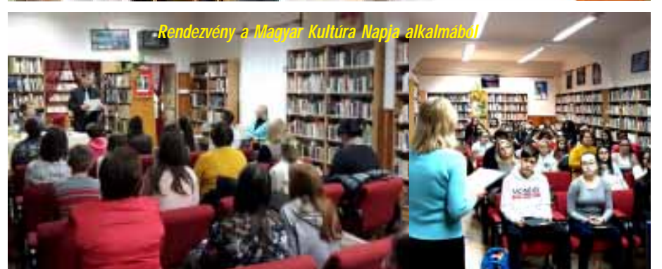
Rendezvény a Magyar Kultúra Napja alkalmából