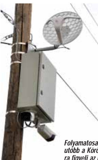
Folyamatosan bővül az önkormányzati térfigyelő kamerahálózat Sarkadon. Legutóbb a Körösháti temető biztonságát garantáló rendszer épült ki, de már kamera figyel az új körforgalom és környékének rendjét is