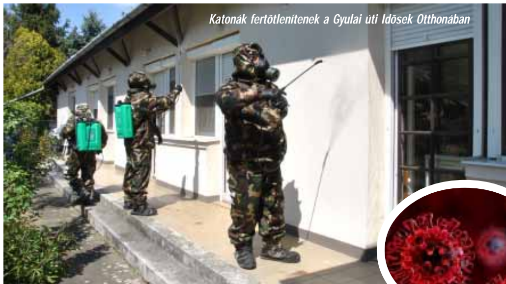
Katonák fertőtlenítenek a Gyulai úti Idősek Otthonában