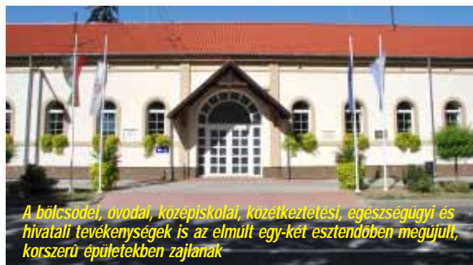
A bölcsődei, óvodai, közepiskolai, közetkeztetési, egészségügyi és hivatali tevékenységek is az elmúlt egy-két esztendőben megújult, korszerű épületekben zajlanak