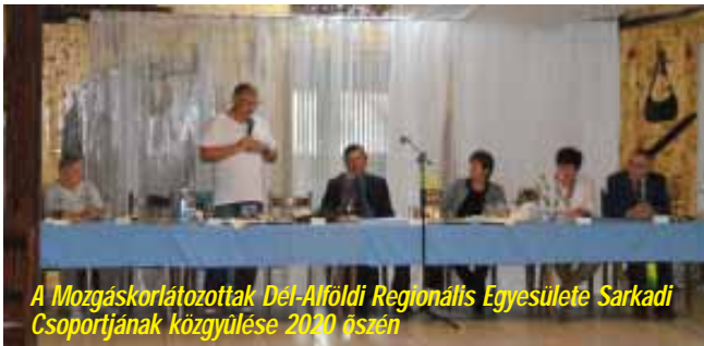
A Mozgáskorlátozottak Dél-Alföldi Regionális Egyesülete Sarkadi Csoportjának közgyűlése 2020 őszén

Az önkormányzat felelős fenntartóként 2020-ban is gondoskodott intézményei stabil, kiegyensúlyozott működéséről, biztosította a járványhelyzet mellett is a gazdálkodáshoz szükséges feltételeket. Ennek eredményeképpen emelni tudta az intézményi szolgáltatások színvonalát, a dolgozói létszámot meg tudta őrizni. Intézményeink 2020-ban is eredményesen működtek.