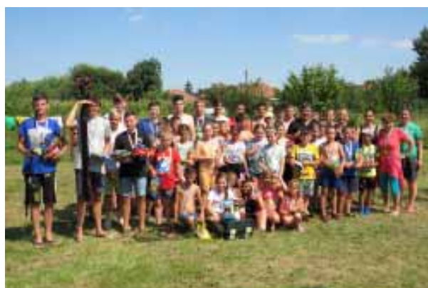
Minden nyáron nagyon népszerűek a Sarkadi Horgász Egyesület és a Sarkadi Eden Horgász Egyesület gyermekprogramjai, táborai