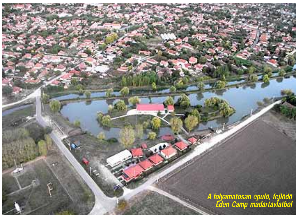
A folyamatosan épülő, fejlődő Éden Camp madártávlatból