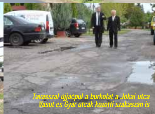
Tavasszal újjáépül a burkolat a Jókai utca Vasút és Gyar utcák közötti szakaszán is