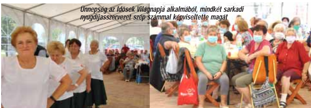
Ünnepség az Idősek Világnapja alkalmából, mindkét sarkadi nyugdíjasszervezet szép számmal képviseltette magát