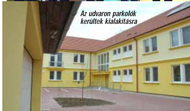
Az udvaron parkolók kerültek kialakításra