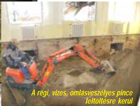
A régi, vizes, omlásveszélyes pince feltöltésre kerül