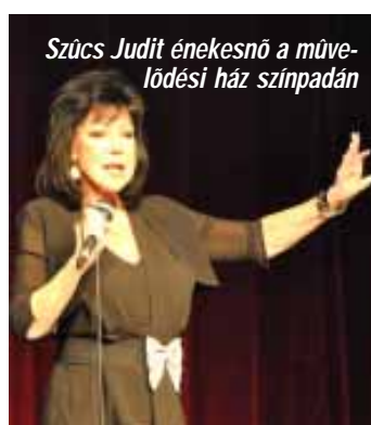
Szűcs Judit énekesnő a művelődési ház színpadán