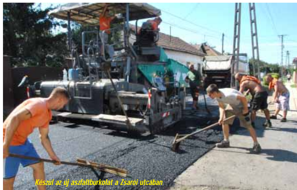
Készül az új aszfaltburkolat a Zsarói utcában