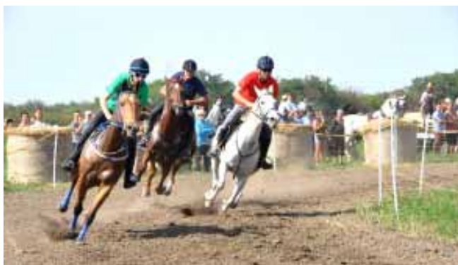
Szeptember 12-én került megrendezésre az Éden Camp szomszéd-ságában a Nemzeti Vágta Sarkadi Előfutama és a Békés Megyei „C” és „D” kategóriás kettes fogathajtó verseny a Lovas- és Fogathajtó Szabadidős Sport Egyesület szervezésében