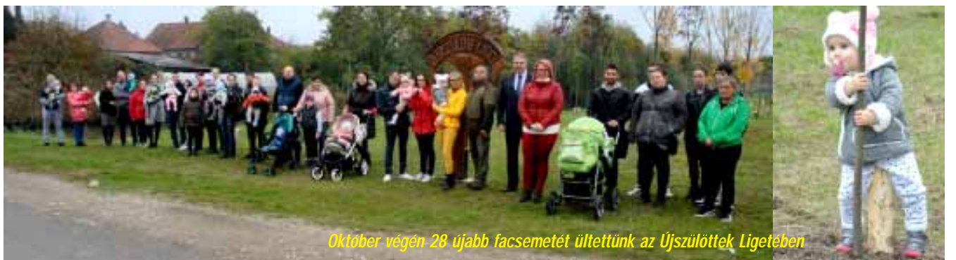
Október végén 28 újabb facsemetét ültettünk az Újszülöttek Ligetében