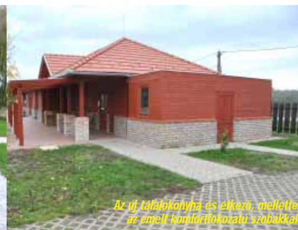
Az új konyha és étkező mellett az emelt komfortfokozatú szobákkal

Folyamatos az Éden Camp fejlesztése, nyáron már több eseménynek is otthont adott a szigeten épített rendezvénycsarnok, amihez modern vizes-blokk csatlakozik, de már a szigetre átvezető új hidak elemei is megérkeztek. A tábor főépülete mellé új konyha és étkező épült, két szoba komfortfokozata emelkedett, rendezvénysátor került telepítésre, napjainkban pedig egy újabb tároló, kiszolgáló egység is megépült.