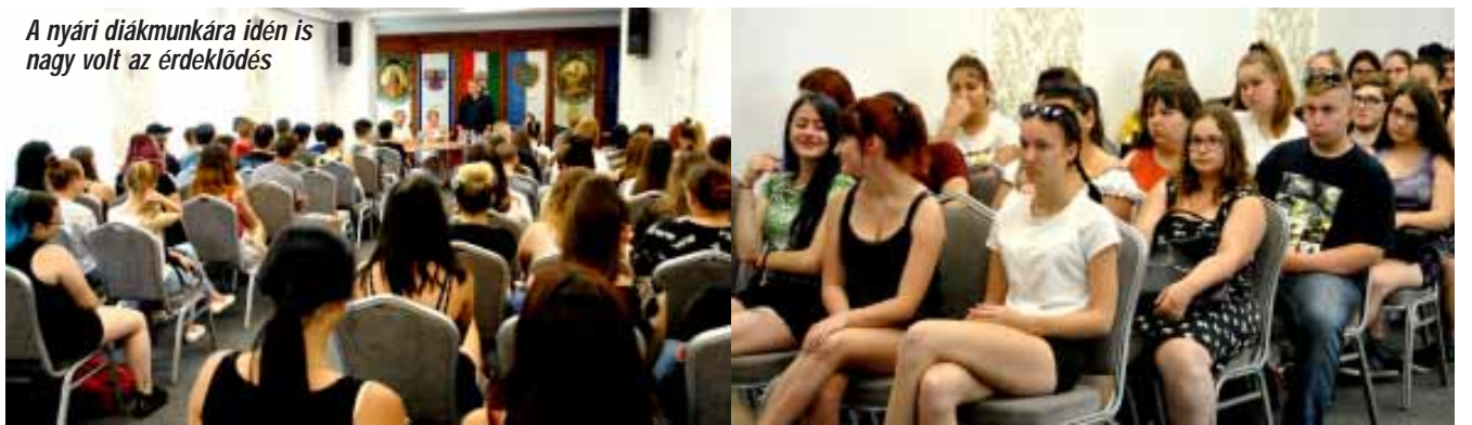
A nyári diákmunkára idén is nagy volt az érdeklődés