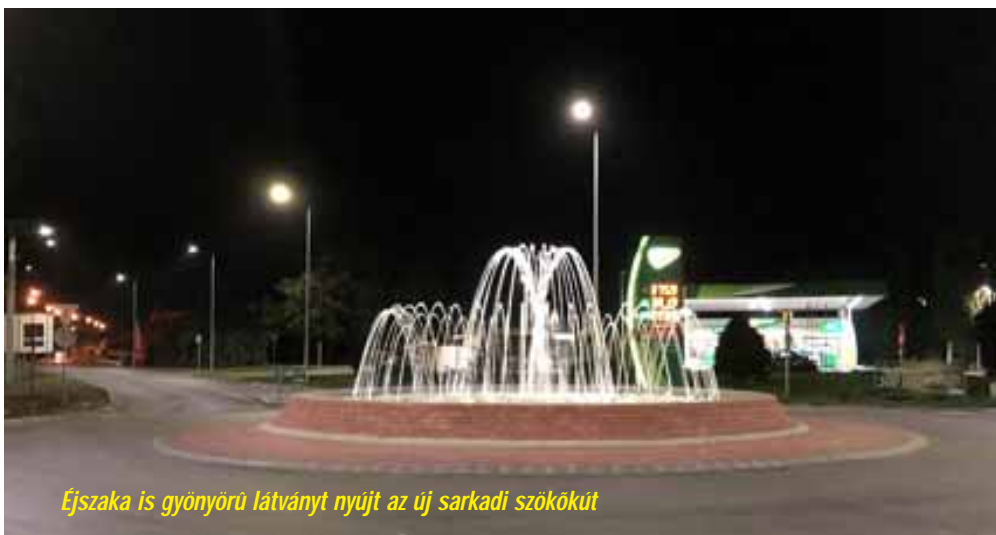
Éjszaka is gyönyörű látványt nyújt az új sarkadi szökőkút