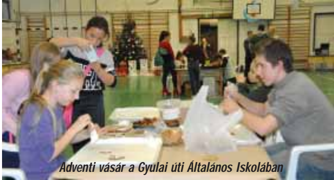
Adventi vásár a Gyulai úti Általános Iskolában