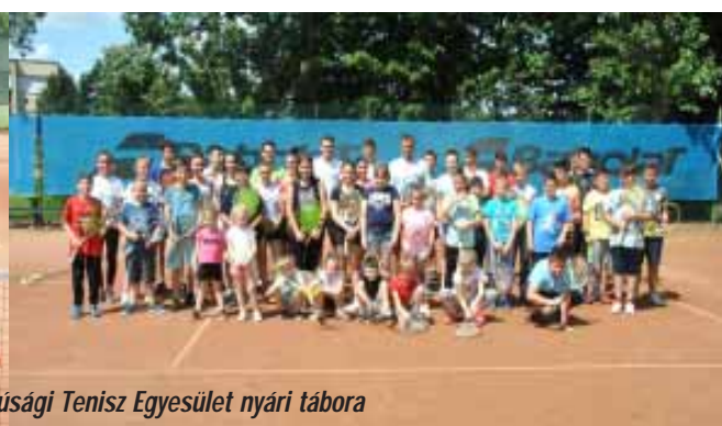
A Sarkadi Ifjúsági Tenisz Egyesület nyári tábora