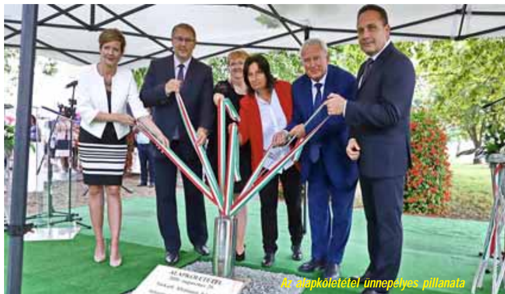
Az alapkövetétel ünnepélyes pillanata

A Kossuth utcai Általános Iskola teljeskörű felújítására és a hozzá kapcsolódó, új városi tornacsarnok építésére a Sarkadi Általános Iskola fenntartását és működtetését jogszabály erejénél fogva ellátó Gyulai Tankerületi Központ, Sarkad Város Önkormányzatának – mint az általános iskola tulajdonosának – támogatásával nyújtott be pályázatot. Ennek eredményeként – a közös érdekérvényesítő munkának köszönhetően – a fejlesztési programra 1.386.045.361 forint összegű támogatást ítélt meg Magyarország Kormányja. Ebből a forrásból teljesen megújult a Kossuth utcai Általános Iskola épülete, felépül az új, városi tornacsarnok, valamint jelentős eszközbeszerzésre is sor kerül.