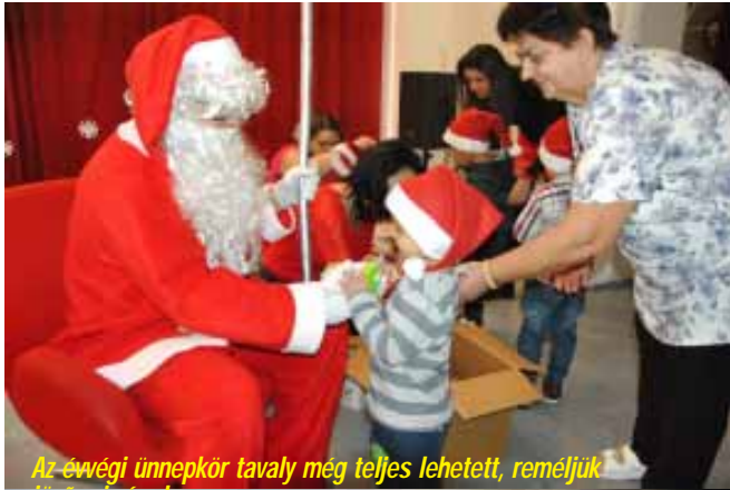
Az évszázadi ünnepkör tavaly meg teljes lehetett, reméljük jövőre is így lesz