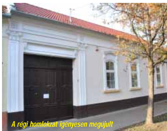
A régi homlokzat igényesen megújult

A „Társadalmi és környezeti szempontból fenntartható turizmusfejlesztés Sarkadon – A Városi Képtár és Kónya Emlékszoba komplex megújítása” című projekt keretében valósult meg a Városi Képtár és Kónya Emlékszoba turisztikai célú komplex fejlesztése. A beruházás keretében a leromlott állagú épület teljes, energiahatékonysági intézkedéseket is magába foglaló felújítására került sor. Ezen kívül az épület hátsó épületrésze elbontásra került, és helyette egy új, akadálymentes épületrész, valamint az ingatlan udvarán akadálymentes parkoló építése valósult meg. Az építési, felújítási munkák mellett a turisztikai attrakció kialakításához, működtetéséhez közvetlenül kapcsolódó, elengedhetetlenül szükséges tárgyi és immateriális eszközök beszerzése is megtörtént.