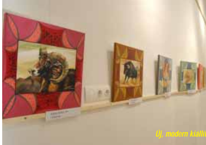
Új, modern kiállítótér létesült