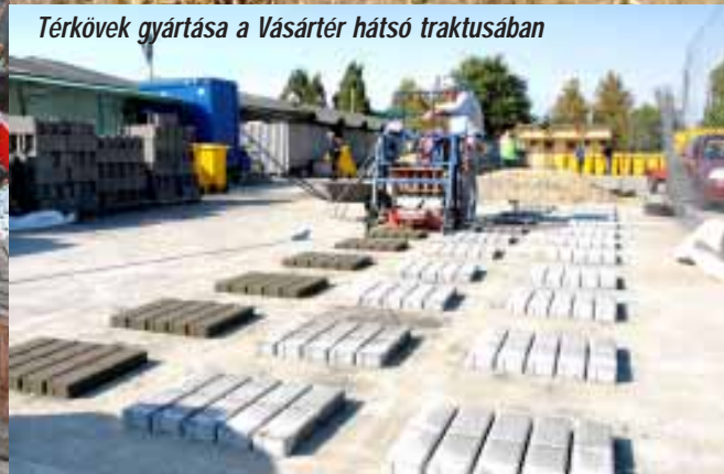
Térkövek gyártása a Vásártér hátsó traktusában