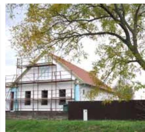
A sarkadi székhelyű Pelikán Vadásztársaság egy, a városunk önkormányzatával közösen megvalósított pályázat révén, 75 millió forint forrásból építi a „Természeti Közösségi Házat” a Sarkadkeresztúri úton