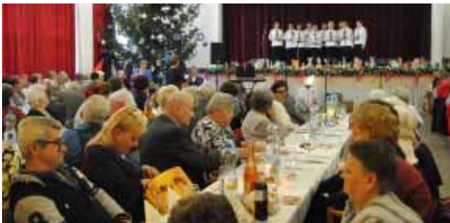
A Mozgáskorlátozottak Békés Megyei Egyesülete Sarkadi Helyi Szervezete évzáró rendezvénye 2019 év végén