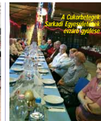
A Cukorbetegek Sarkadi Egyesületének évzáró gyűlése