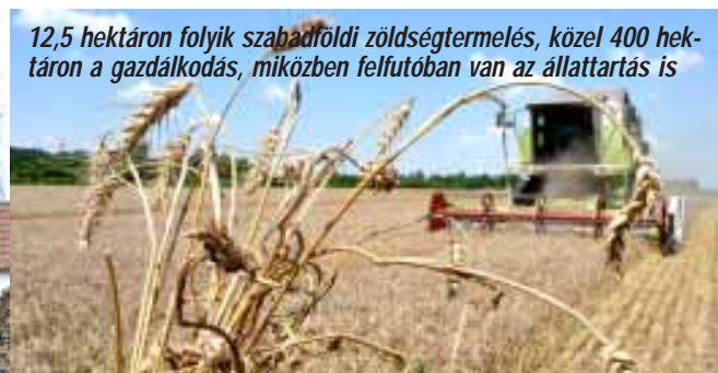
12,5 hektáron folyik szabadföldi zöldségtermelés, közel 400 hektáron a gazdálkodás, miközben felfutóban van az állattartás is