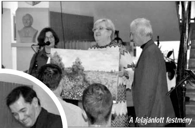
A felajánlott festmény