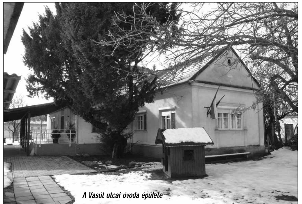
A Vasút utcai óvoda épülete

A település lakosságának szolgálatában a városvezetés nagyon fontos célkitűzésként fogalmazta meg az önkormányzati tulajdonban lévő további intézmények energetikai korszerűsítését is, melynek megvalósítása érdekében Sarkad Város Önkormányzata az elmúlt években több pályázatot nyújtott be a Terület- és Településfejlesztési Operatív Program pályázati felhívásaira, többek között az Epreskert utcai és a Vasút utcai óvodák, valamint a Polgármesteri Hivatal épületének energetikai korszerűsítését célzóva, de például a 60 férőhelyes új bölcsőde építése is egy energetikailag rendkívül korszerű intézménylétrehozását eredményezi.