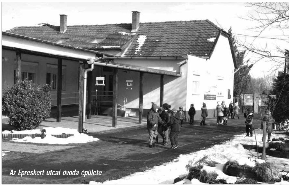
Az Epreskert utcai óvoda épülete