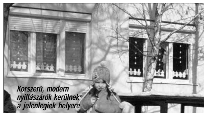
Korszerű, modern nyílászárók kerülnek a jelenlegiek helyére

2019. első negyedévében a házhoz menő szelektív ürités városzerte 2019. február 8-án (péntek) és 2019. március 8-án (péntek) lesz! A szolgáltató törekszik ezeken a napokon valamennyi utcából elszállítani a szelektíven gyűjtött hulladékot. Azokban az utcákban, ahol ez nem sikerül, a szállítást a következő nap pótolja! Kérünk minden érintettet, hogy reggel 06.30-ig helyezze ki a sárga szelektív edényt, mert az ürités egy napon, több járművel történik, az autók 06.00 órakor indulnak békéscsabai telephelyükről és valószínűleg egyes utcák esetében az estébe nyúlik a hulladékgyűjtés! A szolgáltató munkatársai 20.00 óráig dolgoznak, tehát este nyolcig lehet számítani az edények üritésére. Ahogy