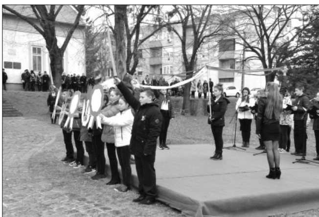
A Sarkadi Általános Iskola diákjainak irodalmi műsora

A sarkadi ünnepek szorúzással zárult, melynek során a város vezetői, illetve a Belvárosi Református Egyházközség és a Városszépítő Egyesület képviselői megkoszorúzták a református lelkész lakán található '48-49-es emléktáblát, majd az ünneplők gyülekezete, városunk vezetői, a városban működő intézmények, politikai pártok és civil szervezetek képviselői elhelyezték az emlékezés és a tisztelet koszorúit a Kossuth-szobor talpzatán. -mk