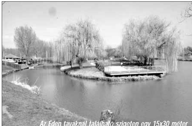
Az Éden tavaknál található szigeten egy 15x30 méter alapterületű fedett közösségi tér, csarnok épül

Természetesen vannak további benyújtott és elbírálásra váró önkormányzati pályázati programjaink is, melyek közé tartozik a Táncsics tér és a Kossuth kert komplex rehabilitációja (100 millió Ft), a városi piac fejlesztése (90 millió Ft), az iparterület fejlesztése a Sarkadkeresztúri úton (200 millió Ft), a Leader program keretében raktár-épület építése az Éden Camp területén, illetve fűnyíró traktor beszerzése, valamint kiszolgáló épület és kerítés építése az ökörményi szabadstrandnál (13 millió Ft), a Kossuth utcai óvoda energetikai korszerűsítése (10 millió Ft), valamint a Zsarói utcai aszfaltburkolatú