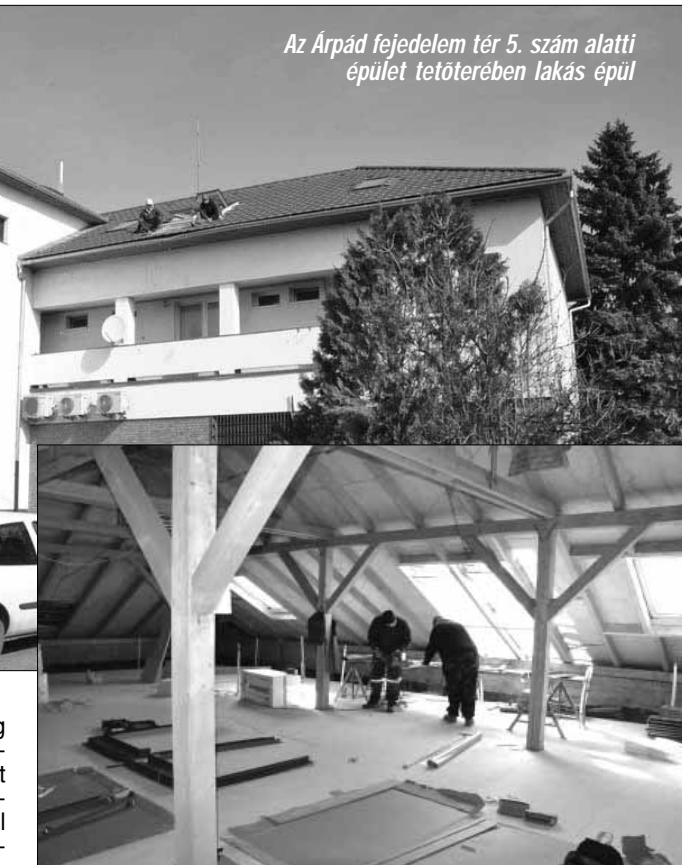
Az Árpád fejedelem tér 5. szám alatti épület tetőterében lakás épül