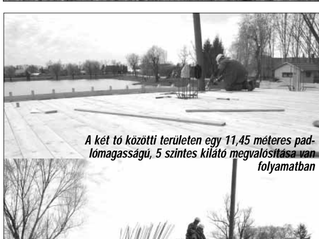
A két tó közötti területen egy 11,45 méteres padlómagasságú, 5 szintes kilátó megvalósítása van folyamatban