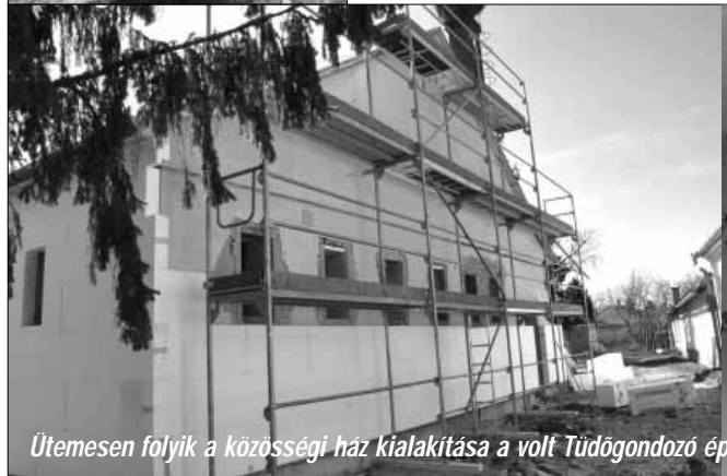
Ütemesen folyik a közösségi ház kialakítása a volt Tüdőgondozó épületében