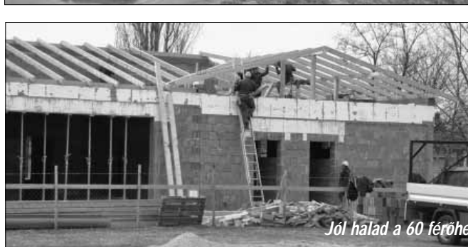
Jól halad a 60 férőhelyes új bölcsőde építése