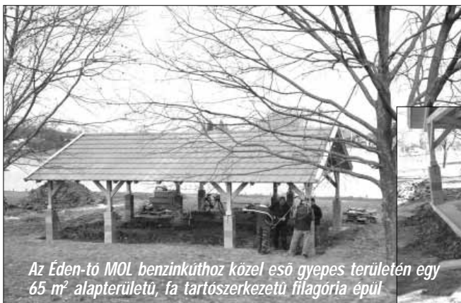
Az Éden-tó MOL benzinkúthoz közel eső gyepes területén egy 65 m² alapterületű, fa tartószerkezetű filagória épül