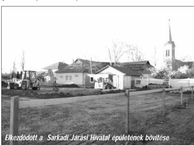
Elkezdődött a Sarkadi Járási Hivatal épületének bővítése