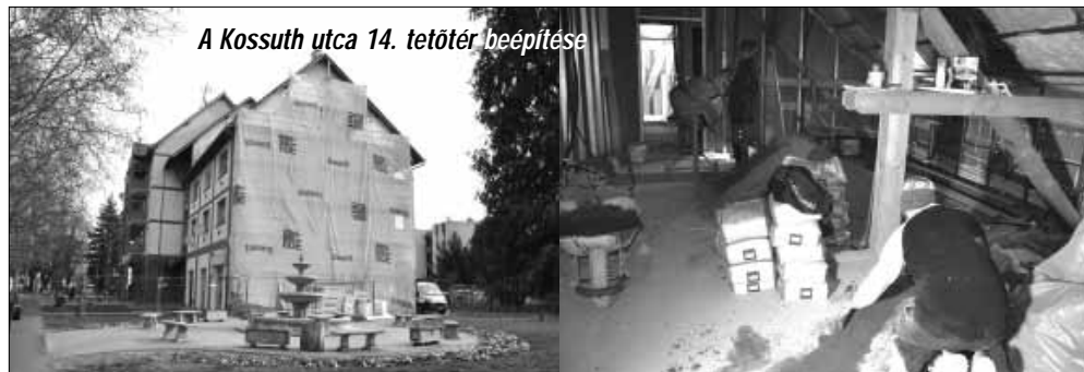
A Kossuth utca 14. tetőtér beépítése