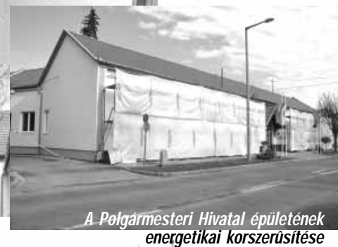
A Polgármesteri Hivatal épületének energetikai korszerűsítése