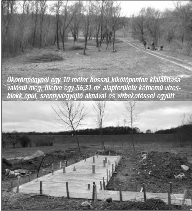
Ökörörménynél egy 10 méter hosszú kikötőpontra kialakítása valósul meg, illetve egy 56,31 m 2 alapterületű kétnemű víz-blokk épül, szennyvízugyjtó aknával és vízbekötéssel együtt