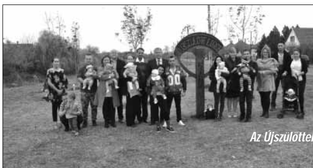
Az Újszülöttek Ligete az újszülöttekkel