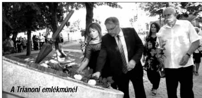
A Trianoni emlékműnél