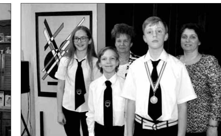
Zrínyi Matematika Verseny sarkadi díjazottjai