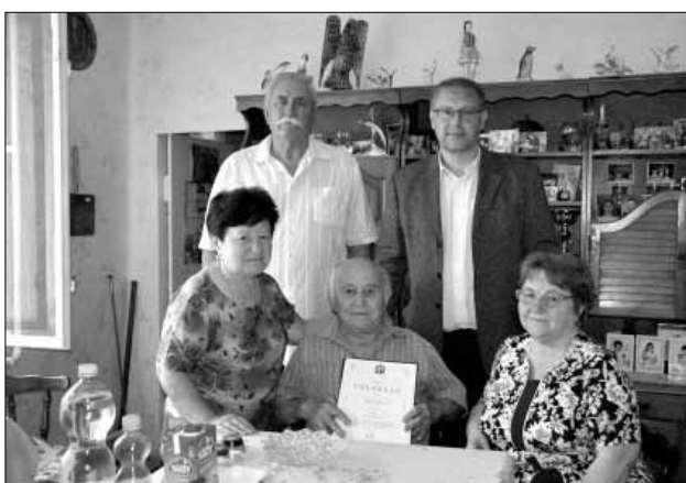
Időszerű sarkadi polgártársunk köszöntése