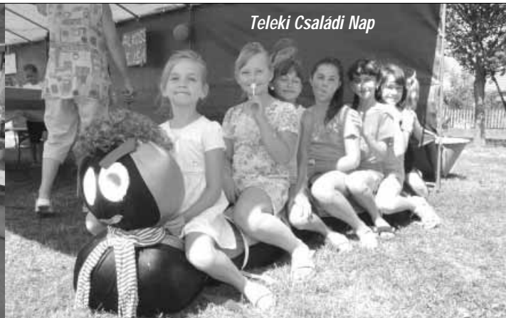
Teleki Családi Nap