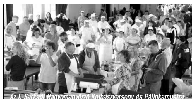
Az I. Sarkadi Hagyományörző Kolbászverseny és Pálinkamustra