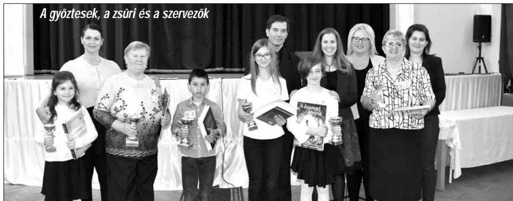
A győztesek, a zsűri és a szervezők