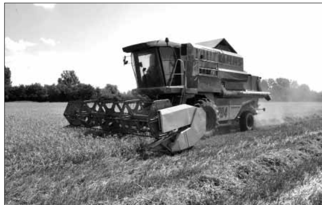
Jelenleg Sarkad Város Önkormányzata közel 400 hektáron gazdálkodik