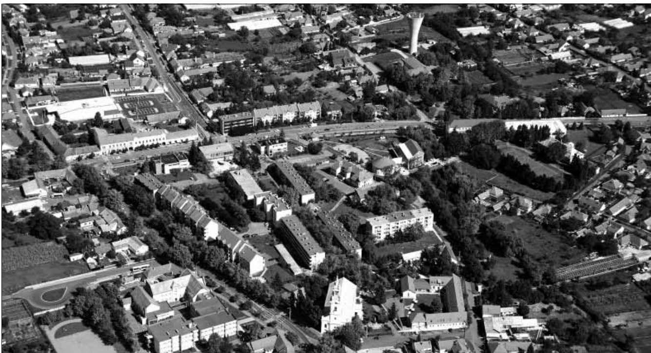
Sarkad belvárosának létképe a magasból napjainkban

Sarkad területe már a honfoglalást megelőzően is lakott volt, majd a honfoglalást követően, szinte azonnal megjelent a magyarság ezen a vidéken. A város környékének stratégiai értékét jelentősen növelte, hogy igen jól védhető, mocsaras vidék volt, s ezt felismerve már a honfoglalást követő időszakban erődítményt építettek ezen a területen, melyet a források Peckes-vár néven említenek.