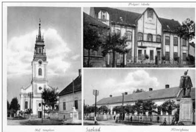
Postai üdvözlő képeslap Sarkad nagyközségből a 60-as években