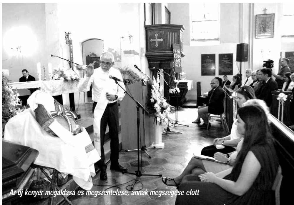
Az új kenyér megáldása és megszentelése, annak megszegése előtt