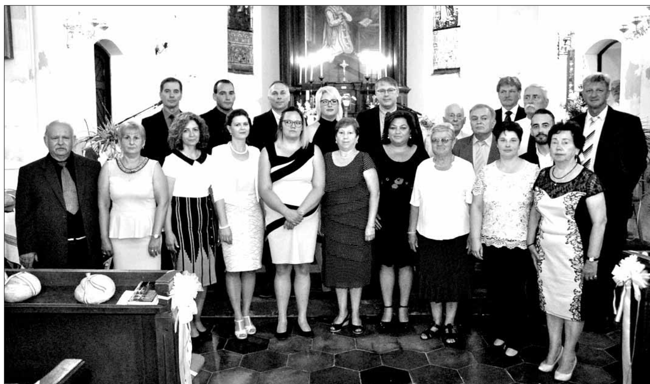
A kitüntetettek és a város vezetői