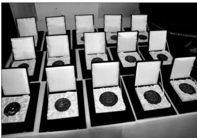
Augusztus 20-án a városi ünnepség keretében átadásra került díjak, kitüntetések és emlékérmek