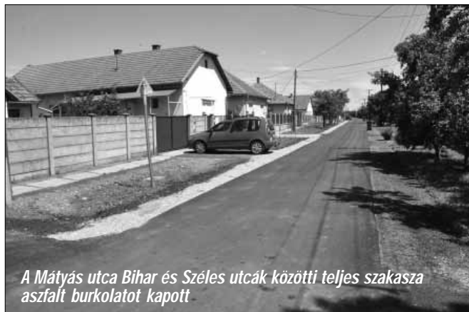
A Mátyás utca Bihar és Széles utcák közötti teljes szakasza aszfalt burkolatot kapott