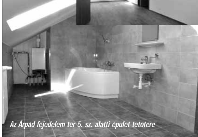
Az Árpád fejedelem tér 5. sz. alatti épület tetőtere