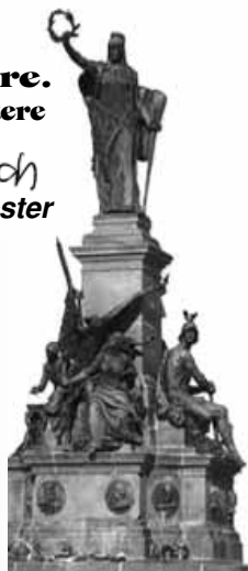
(Az aradi Szabadság szobor)