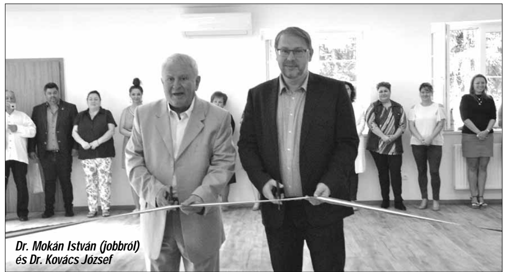
Dr. Mokán István (jobbról) és Dr. Kovács József

2019. szeptember 16-án délelőtt a volt Vasút utcai Tüdőgondozó leromlott épületének felújításával kialakított modern közösségi házban dr. Mokán István polgármester és dr. Kovács József országgyűlési képviselő köszöntőjét követően kerültek átadásra a településünk négy projektelemét is magába foglaló szociális városrehabilitációs programja keretében megvalósított beruházások.