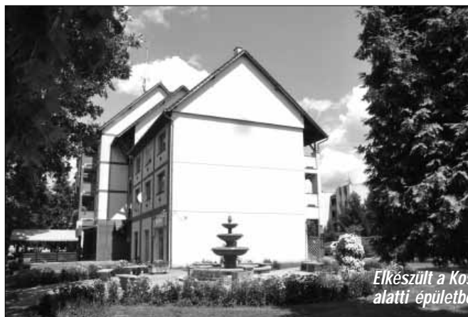
Elkészült a Kossuth utca 14. szám alatti épületben a tetőtér beépítése