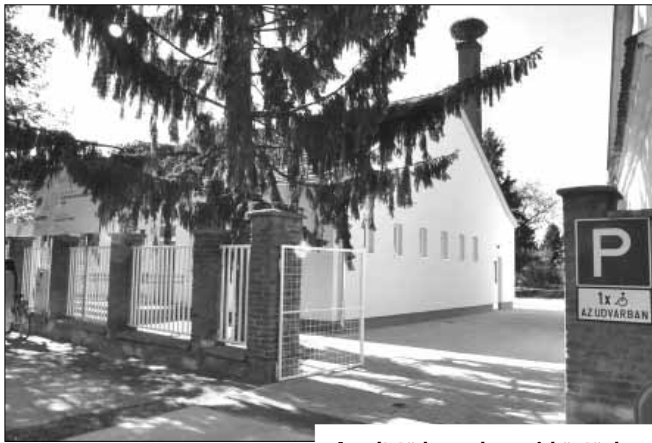
A volt tüdőgondozó új köntösben