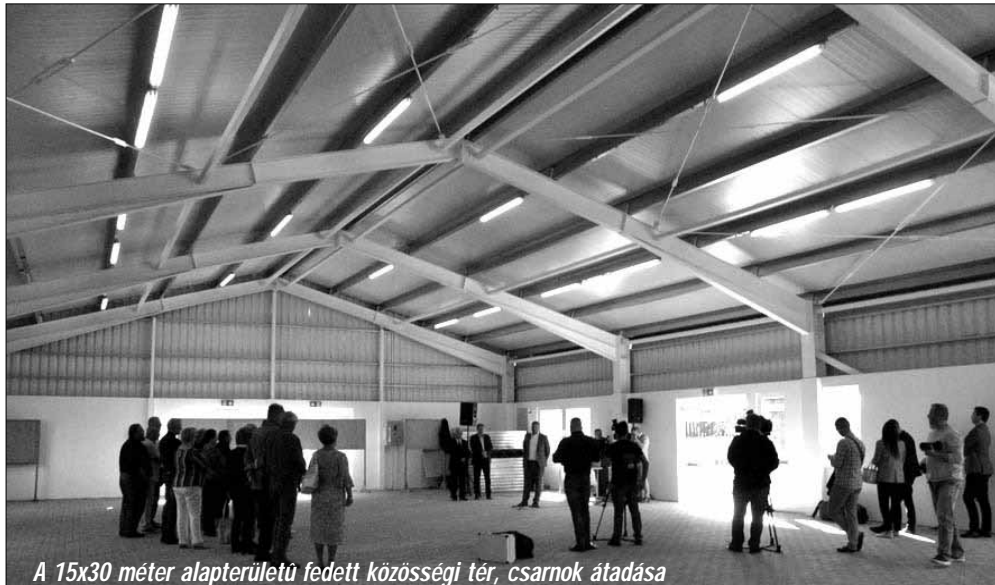
A 15x30 méter alapterületű fedett közösségi tér, csarnok átadása

Sarkad Város Önkormányzata az elmúlt néhány esztendőben már több olyan beruházást is megvalósított, melyek a település eddig még kihasználatlan turisztikai lehetőségeinek kiaknázását és fejlesztését céloz-