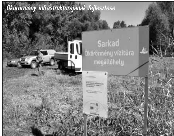
Ökörörmény infrastruktúrájának fejlesztése