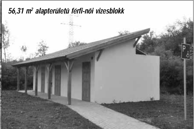
56,31 m 2 alapterületű férfi-női vizesblokk