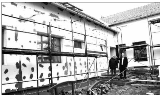
Készül a hőszigetelő burkolat a belső udvar épületfalán