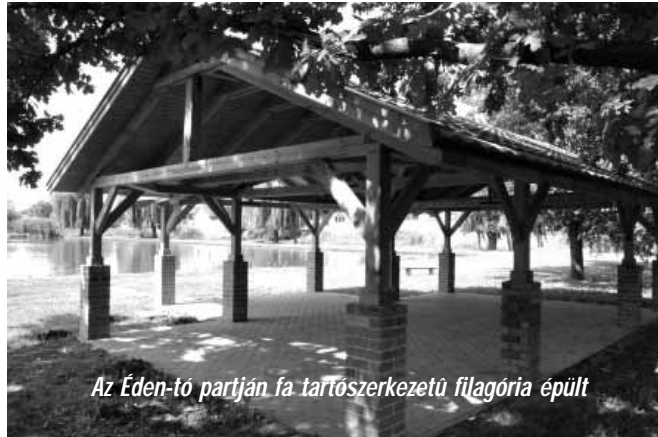
Az Éden-tó partján fa tartószerkezetű filagória épült