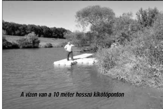
A vízen van a 10 méter hosszú kikötőpontra