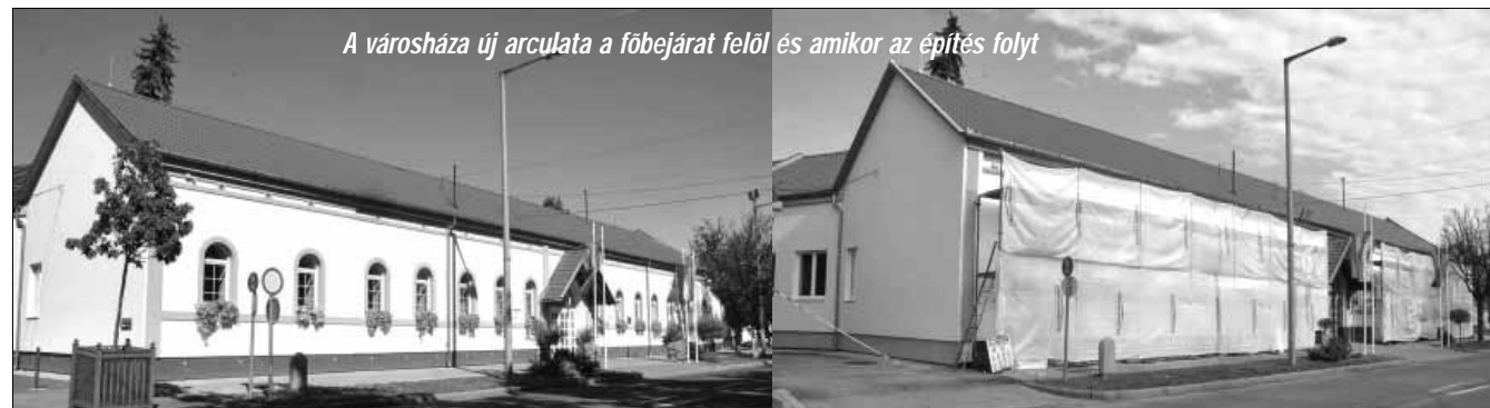
A városháza új arcúlat a főbejárat felől és amikor az építés folyt