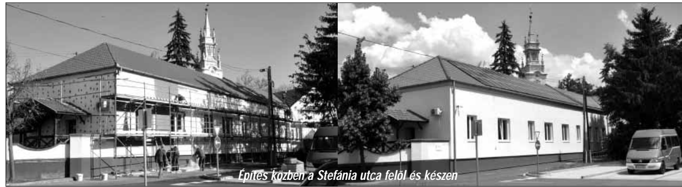
Építés közben a Stefánia utca felől és készen