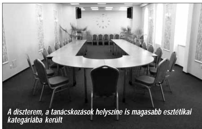
A díszterem, a tanácskozások helyszíne is magasabb esztétikai kategóriába került

nyújtott be a Terület- és Településfejlesztési Operatív Program pályázati felhívására, többek között az Epreskert utcai és a Vasút utcai óvodák, valamint a Polgármesteri Hivatal épületének